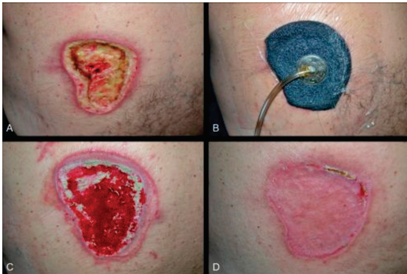
Figura 1. Paciente masculino, 58 anos, paraplégico. A) Úlcera por pressão na região lombar esquerda, com leito da ferida repleto de tecidos desvitalizados. B) Aplicação da TPN após desbridamento cirúrgico. C) Aspecto após TPN, com melhora do tecido de granulação no leito da ferida, antes da enxertia de pele. D) Pós-operatório com cobertura cutânea da ferida, após integração satisfatória do enxerto de pele.

grupo da TPN ( p=0,75 ). Os autores afirmam que a TPN promove a cicatrização e a neovascularização quando comparada com o tratamento tópico com gel 20 .