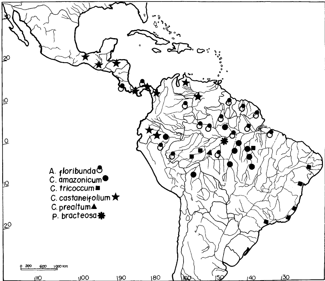
Figura 17. Distribuição geográfica de Alchorneopsis floribunda , Cleidion amazonicum , C. tricoccum , C. castaneifolium , C. prealtum e Polyandra bracteosa na região neotropical.

Leal (1951) forneceu uma descrição detalhada deste gênero e da espécie, bem como uma boa ilustração de P. bracteosa . Apesar disso, a identidade e a posição sistemática de Polyandra ainda são objetos de controvérsia.