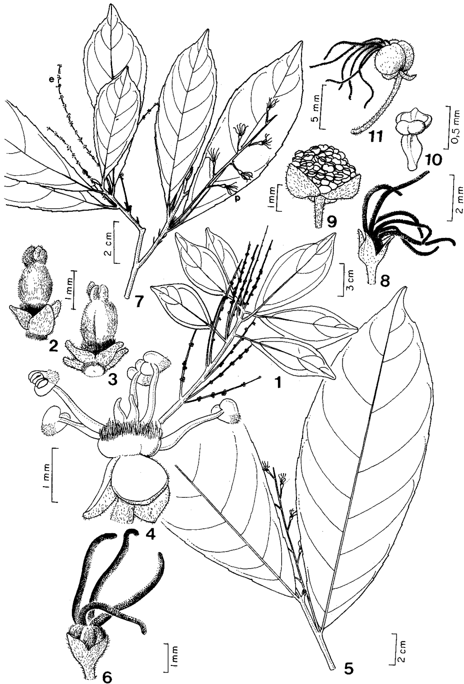
Figuras 1-4. Alchorneopsis floribunda (Benth.) Muell. Arg. 1. Ramo com inflorescência em racemo ( Krukoff 6386 ); 2-3. Flores pistiladas com cálice trímero ( Herb. 2696 ) e pentâmero ( N. A. Rosa 733 ), respectivamente; 4. Flor estaminada com pistilódio central ( Krukoff 6386 ). Figuras 5-6. Cleidion amazonicum Ducke. 5. Ramo com inflorescência pistilada em racemo; 6. Flor pistilada com ovário bilocular ( Ule 5262 ). Figuras 7-11. Cleidion tricoccum (Casaretto) Baillon. 7. Ramo com inflorescências estaminadas (e) e pistiladas (p); 8. Flor pistilada com ovário trilocular; 9. Flor estaminada; 10. Estame; 11. Fruto jovem ( J. C. Moraes 1084 ).