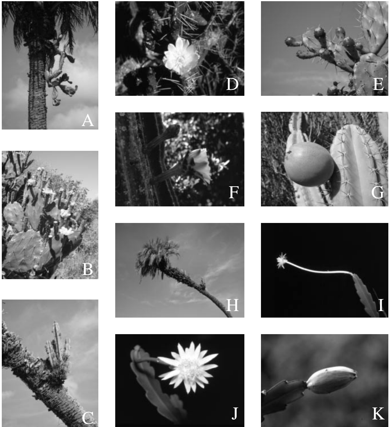
Figuras 1A-K. Opuntia monacantha Haw.: A. Epifítico sobre Butia capitata . B. Planta terrícola. D. Flor. E. Frutos. Cereus alacriportanus Pfeiff.: C, H. Epifítico sobre Butia capitata inclinado. F. Flor. G. Fruto maduro. Epiphyllum phyllanthus (L.) Haw.: I, J. Flor. K. Fruto maduro.