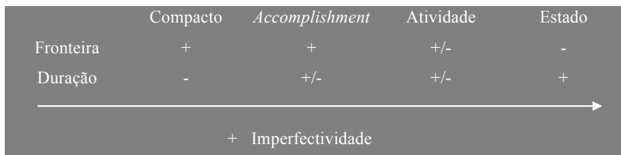
Quadro 3 – Escala de marcação de im(perfectividade)