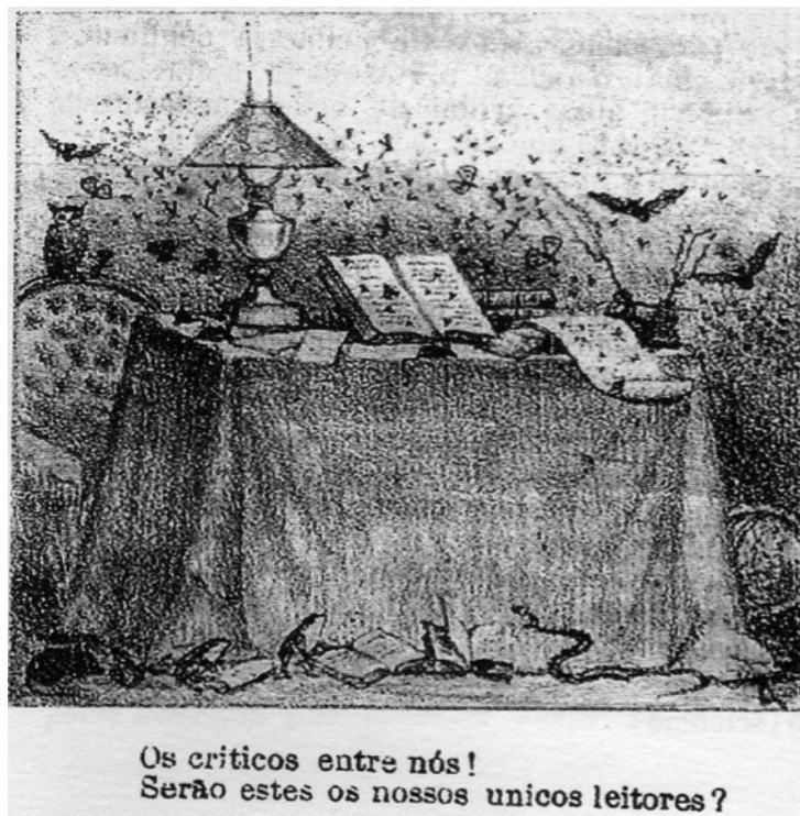
Figura 2 - Imagem do jornal Diabo-Coxo , nº1, 1864. Jornal domingueiro com 8 páginas, 4 de ilustrações (caricaturas, retratos, cenas do dia a dia e ventos) e 4 de textos (artigos, poesias, notícias, críticas, anedotas, advinhas, etc.), dos quais se ocupava Luiz Gama e Sizenando Barreto Nabuco de Araújo, irmão de Joaquim Nabuco. Diabo Coxo . São Paulo: Edusp, edição fac-similar, 2005.