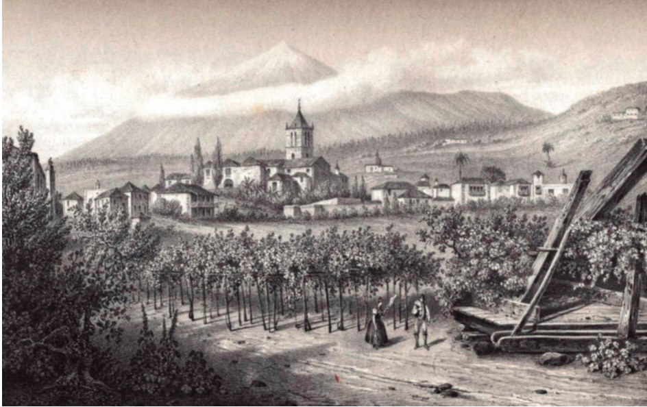
Figura 2. Viñedos de malvasía en “carreras altas”, (grabado de J. J. Williams, 1836).

El papel fundamental que adquirieron los derechos de explotación comunal de los montes para la subsistencia de la población más pobre, acabó afirmando la creencia popular de que los montes de propios eran el “patrimonio de los pobres”. Es comprensible, por lo tanto, la dualidad de lenguajes que usaban los oficiales del Concejo y los campesinos para referirse a los “montes de propios”, mientras que para los primeros los montes de Tenerife eran montes del Concejo, para los segundos siempre fueron montes del rey, concedidos a los vecinos como gesto de magnanimidad real.