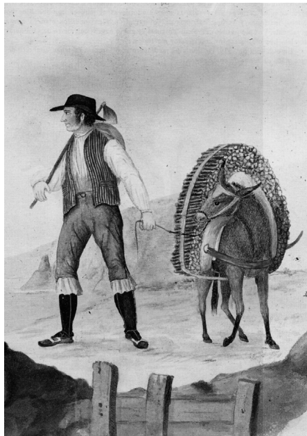
Figura 3. Leñador de La Orotava (dibujo de Alfred Diston, 1824).

El perfil social de los actores directos que asolaron el monte en el siglo XVIII (los campesinos pobres) enlaza las teorías recientes sobre la relación entre pobreza, desigualdad social y deterioro medioambiental. Tal como se ha indicado “the total magnitude of environmental harm depends of the extent inequality” (Boyce, 2008). La correlación entre pobreza y deterioro medioambiental ha llevado a plantear que “the poor do not initially or indirectly degrade the environment. The response is qualified, because it is contingent upon the activities of the other groups” (DURAIAPPAH, 1998).