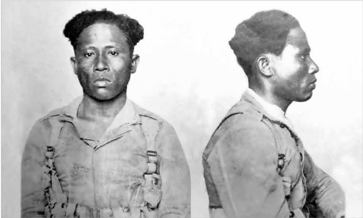
Figura 5. Fotografia de um 'Xanthodermo'.

novamente o exemplo de Fischer, Roquette-Pinto destacava a importância dos estudos estatísticos desenvolvidos pelo britânico Francis Galton para o aperfeiçoamento do método biométrico e sua aplicação à moderna biologia 15 . Embora chamasse a atenção para o fato de que os primeiros trabalhos biométricos tivessem surgido com o naturalista belga Adolphe Quetelet, em 1835, e, mais tarde, divulgados por Adolphe Bertillon junto à Sociedade de Antropologia de Paris, teria sido o eugenista Francis Galton o principal responsável por transformar a biometria numa ciência importante para o exame do material antropológico e para os estudos eugênicos (Roquette-Pinto, 1929, p. 132).