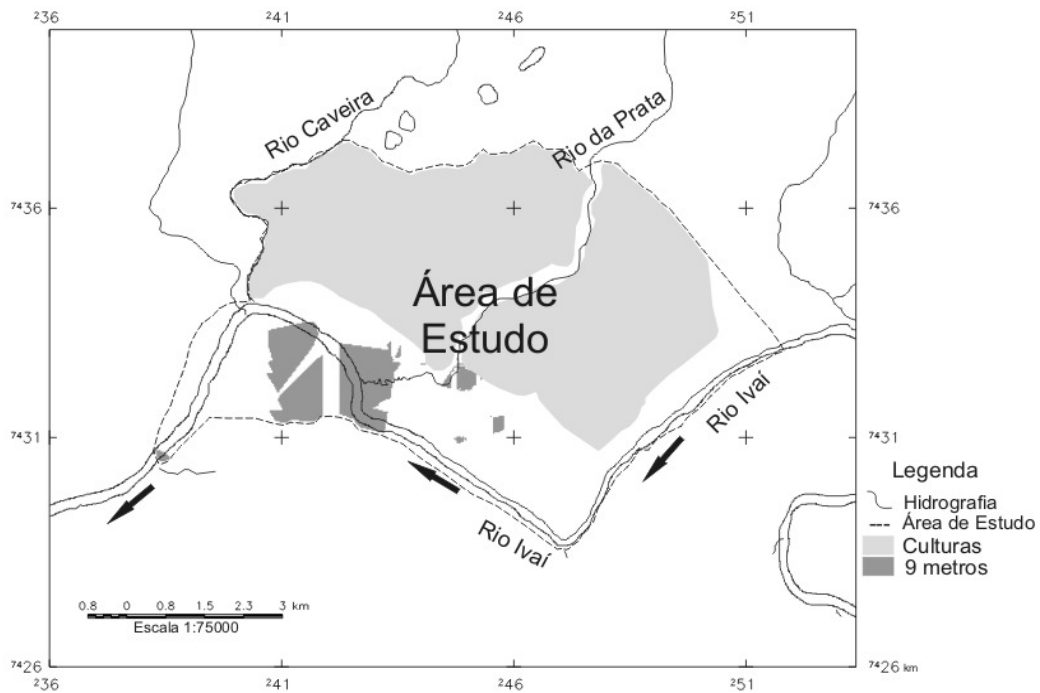
Figura 2. Leito maior sazonal em 9 metros e sua localização aproximada às culturas locais.