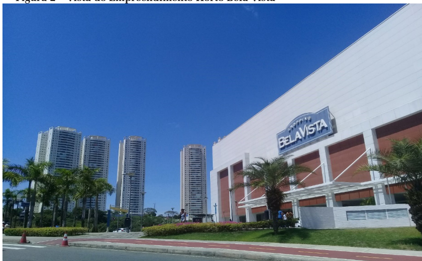
Figura 2 – Vista do Empreendimento Horto Bela Vista