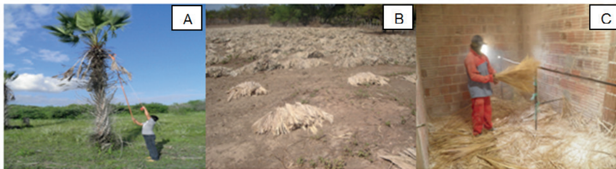
Figura 4 Retirada das folhas (A), secagem (B) e batiação das folhas de carnaúba (C). Ipanguaçu, Rio Grande do Norte (RN).

Os trabalhadores exercem funções diferenciadas no processo de extração do pó cerífero da C. prunifera , que se divide em quatro etapas: corte, transporte, secagem e batiação (retirada do pó) das folhas (Figura 4). A extração do pó inicia-se com o corte das folhas pelos cortadores, que são os agentes responsáveis pela derrubada das folhas com o auxílio de foice acoplada a uma vara de bambu. As folhas são recolhidas e conduzidas ao local de secagem a pleno sol (área aberta), chamado de estaleiro, utilizando animais de carga (burros ou jumentos) para realizar o transporte. Após a secagem, as folhas são batidas manualmente, para que ocorra o desprendimento do pó, que é, então, recolhido e comercializado.