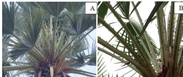
Figura 1 Carnaúba branca, sem espinhos no pecíolo (A) e carnaúba comum, com espinhos no pecíolo (B). Ipanguaçu, Rio Grande do Norte (RN).

Quando perguntado se existia variabilidade fenotípica na espécie, os moradores afirmaram existir “dois tipos” (73%), chamadas de carnaúba comum e carnaúba branca, sendo diferenciadas pela presença de espinhos no pecíolo na carnaúba comum e ausência dessa estrutura na carnaúba branca (Figura 1).