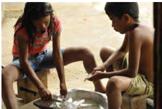
Fotografia de Lucie Robieux.