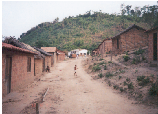
Figure 2 - Typical image of rural Buriticupu. Figura 2 - Imagem típica encontrada nas áreas rurais.

Students participating in the Bandeira Científica project are invariably challenged to cope with some of the difficulties inherent to these poor communities; upon returning home to São Paulo, a new set of concepts occupies their minds. As in other occasions, this issue of the Bandeira