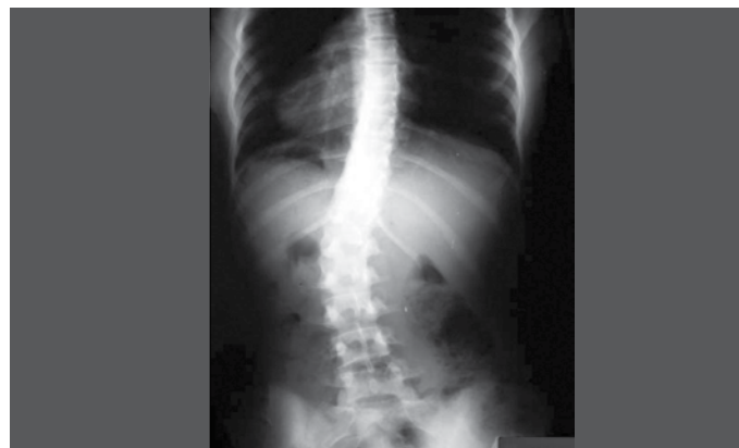
Figura 1. Exemplo de imagem radiográfica ântero-posterior utilizada para mensuração angular de coluna escoliótica.

Os nomes dos pacientes na identificação dos exames foram subtraídos e substituídos por etiquetas numeradas aleatoriamente (Figura 1). Foram utilizadas a mesma régua própria para medição de curva escoliótica de haste única, a mesma lapiseira e as mesmas condições para todos os participantes (Figura 2). Após a primeira medição por cada um dos profissionais, nova medição por cada um dos representantes de cada categoria foi realizada, mas com nova organização na ordem de identificação numérica dos exames e intervalo mínimo de duas semanas entre a primeira e a segunda medição, com o intuito de reduzir algum efeito de memorização.