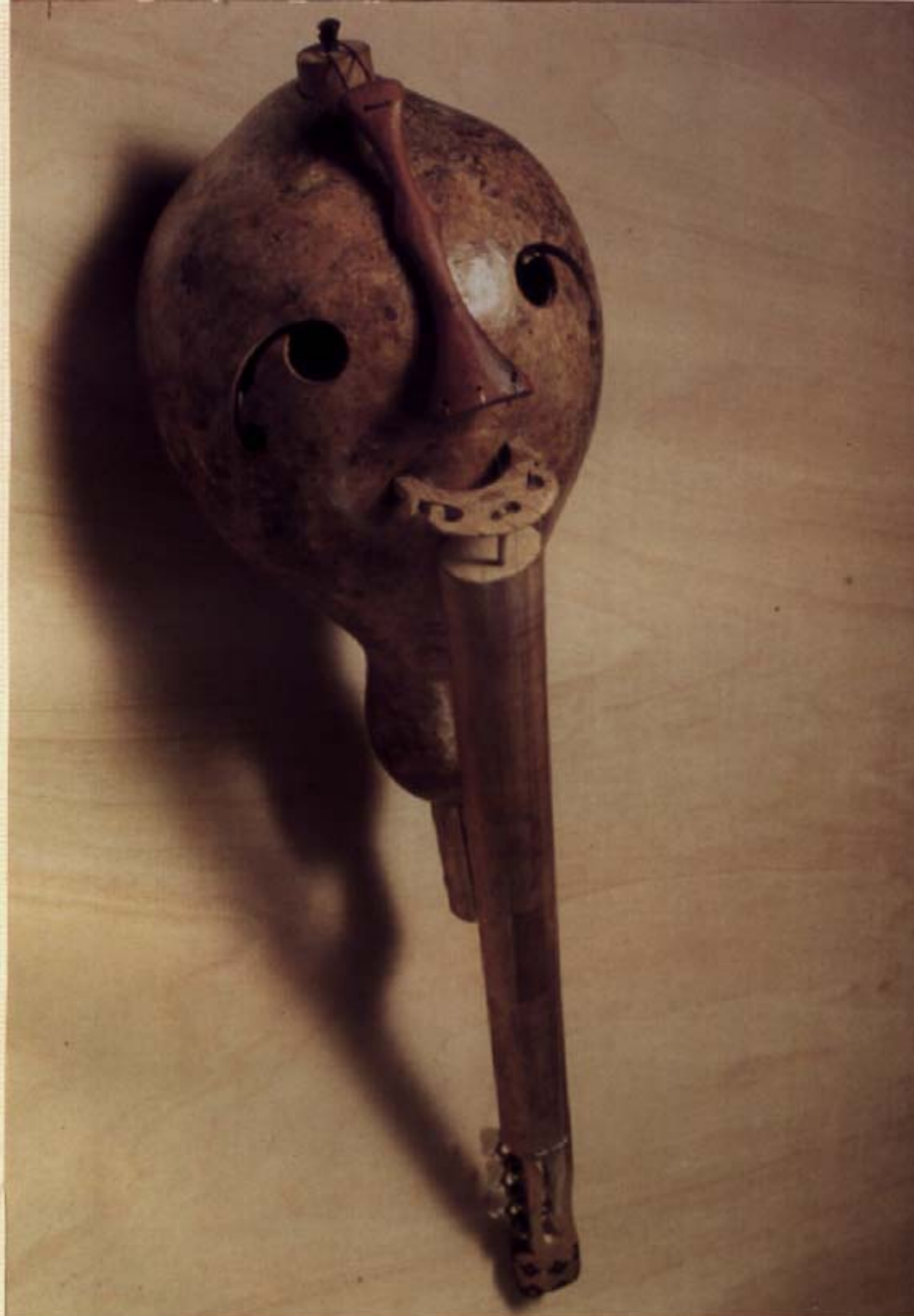
© 1994 Cristiano Quintino - CHORINHO