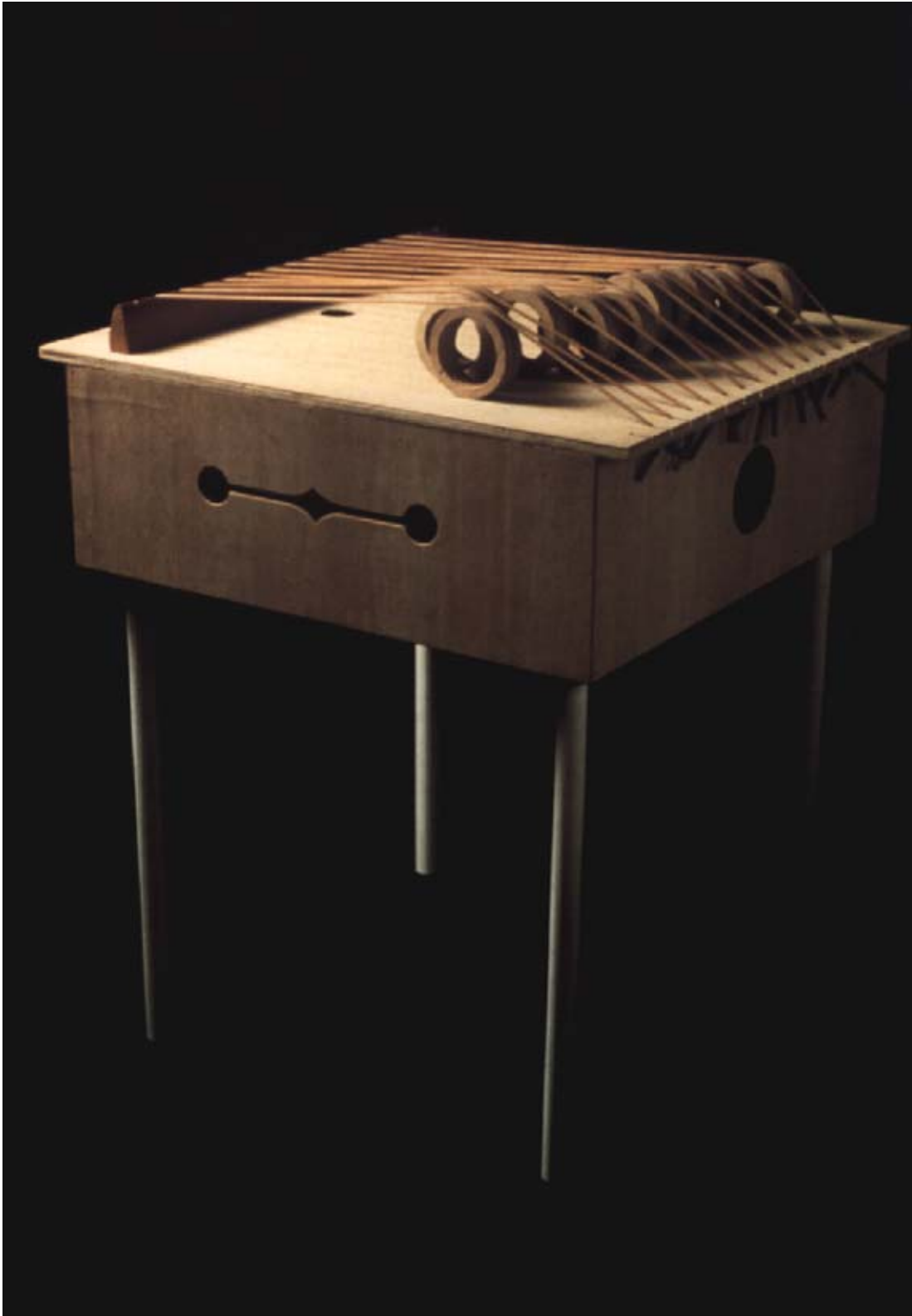
© 1994 Cristiano Quintino - PLANETÁRIO