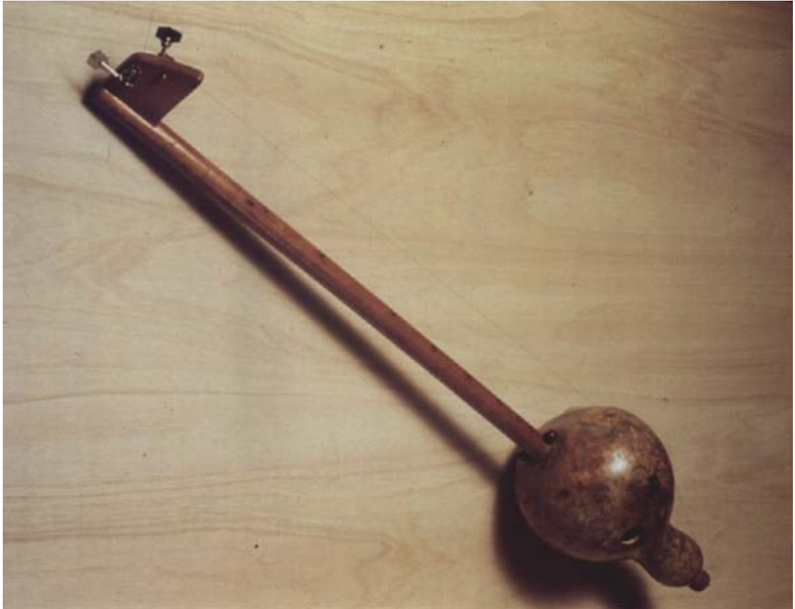
© 1994 Cristiano Quintino - PEIXE