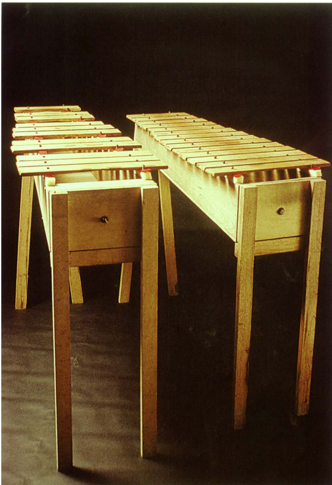
© 1994 Cristiano Quintino - MARIMBA D'ANGELIM