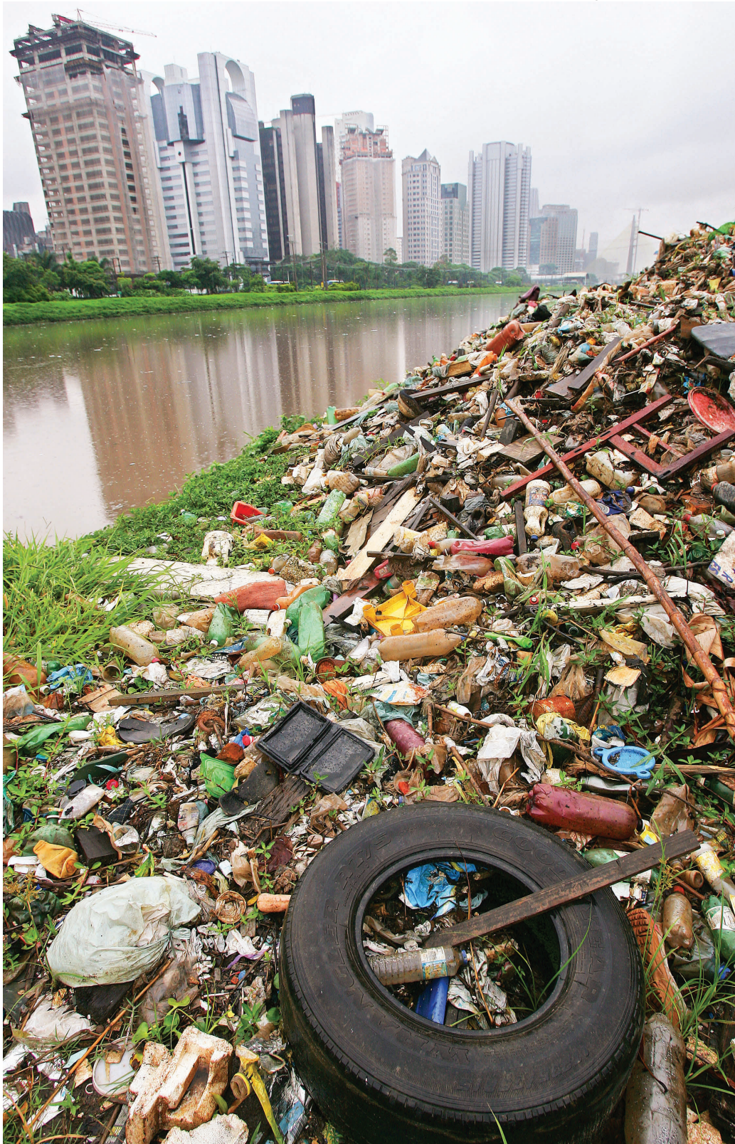
Lixo acumulado na margem do Rio Pinheiros, em São Paulo, em razão das chuvas.