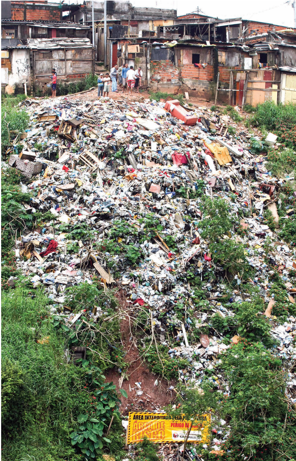
Deslizamento na Favela Santa Madalena, bairro de Sapopemba, Zona Leste de São Paulo.