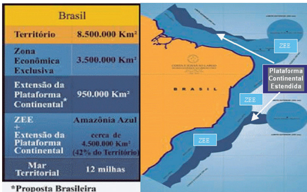
Figura 1 – Limites do Mar I.