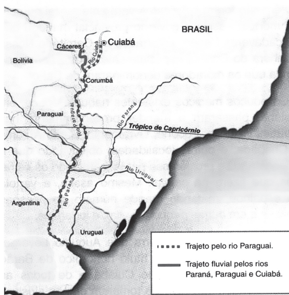
Mapa 2 -Trajeto fluvial na bacia do Prata (1870 a 1930)

Entretanto, a rota pelo estuário da Prata permanecia bloqueada aos luso-brasileiros, sendo controlada pelos espanhóis “[...] até o médio curso do rio Paraguai, onde possuíam não apenas Assunção como também, mais ao norte, a vila de Concepción (1773) [...]” (Queiroz 2011, 110).