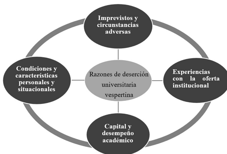
Figura 1- Categorías de factores emergentes de estudiantes desertores universitarios vespertinos