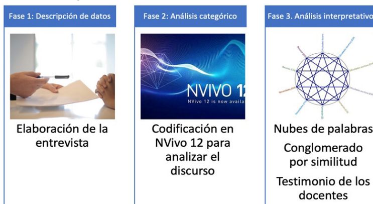
Figura 1 – Fases de la investigación