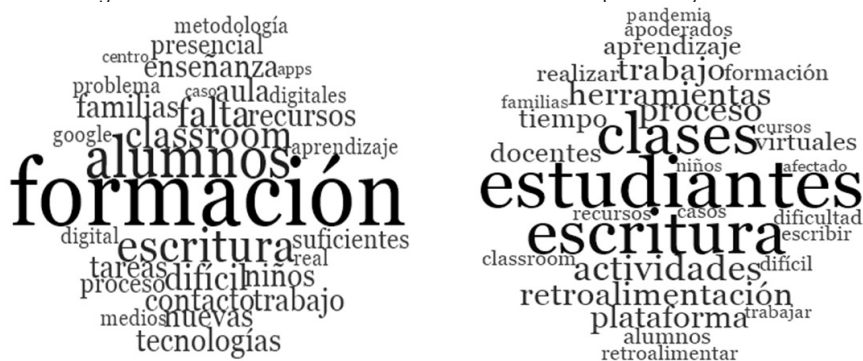
Figura 2 – Visión global de los focos de interés de los docentes españoles y chilenos