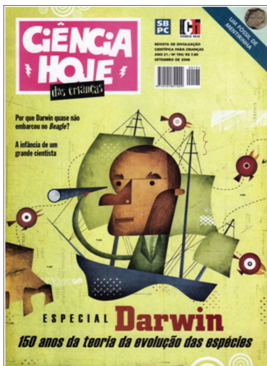
Figura 3 – Capa da revista CHC , edição de setembro de 2008

A capa da edição comemorativa de 2008 3 destaca a viagem realizada pelo naturalista como convite ao leitor para o conhecimento da infância do “grande cientista”. Também na capa dessa revista, visualiza-se a referência de um tema que será tratado na maior parte dos artigos dessa edição: a vida e a obra de Charles Darwin. Tendo em vista que, em 2008, comemoraram-se 150 anos da teoria da evolução, esse número da Ciência Hoje das Crianças destaca o tema em sua capa (Figura 3).