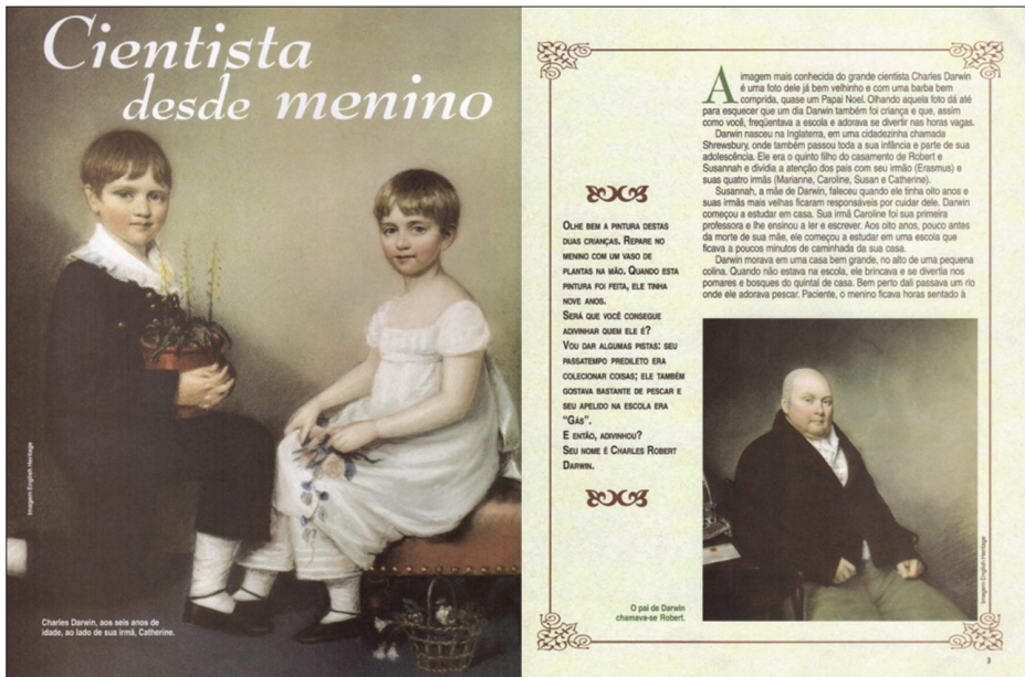
Figura 4 – Páginas 2 e 3 da CHC , edição de junho de 2008

Nesse artigo, as imagens do pai e dos irmãos de Darwin, em quadros pintados a óleo, com trajes da época, cartolas, livros, reforçam a ideia do pertencimento do naturalista a uma família abastada. O artigo da revista CHC relata uma viagem do cientista aos dez anos de idade, durante a qual teve a oportunidade de observar vários insetos e fez com que, mais tarde, se tornasse um colecionador de besouros. A fotografia de besouros na página seguinte é a chamada para a leitura de um episódio em que o cientista, na tentativa de capturar os insetos, coloca um besouro entre os dentes. A imagem e a descrição do episódio servem para aproximar o leitor de como ele foi se constituindo como cientista. Embora prevaleça a opção por explorar episódios da vida do cientista na infância e na juventude, a fotografia mais conhecida do naturalista com idade avançada é apresentada às crianças no fim do texto. A referência textual à imagem de Darwin é diferente da imagem pictórica e não auxilia as crianças no reconhecimento do cientista porque a maioria das crianças não têm informações sobre a sua vida e obra.