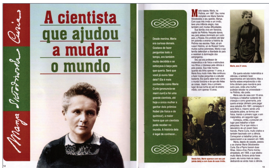
Figura 6 – Páginas 12 e 13 da CHC , edição de julho de 2011

Em toda a extensão do artigo, Marie Curie é apresentada às crianças em diferentes momentos de sua vida a partir de fotografias em que aparece sozinha, com sua família, dirigindo ambulâncias com aparelhos de raio X, no laboratório, com o marido no passeio de bicicleta e com suas filhas. Dessa forma, o marido e as filhas aparecem no artigo como elementos importantes para a constituição de sua vida como pessoa e pesquisadora. O exercício da profissão de pesquisa ganha um sentido mais amoroso, feminino e materno. Esses aspectos da vida da cientista, em contraste com as imagens de Einstein e Darwin nos textos anteriores, em que não aparecem com suas famílias, exceto quando crianças, pode reforçar uma visão estereotipada da mulher na sociedade.