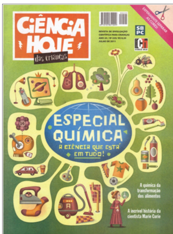
Figura 5 – Capa da revista CHC , edição de julho de 2011

A edição que traz Marie Curie, “Especial Química – A ciência está em tudo!” 4 , de 2011, ressalta os elementos químicos em alimentos, medicamentos e meio ambiente. Tal como nos dois outros números da CHC aqui apresentados, essa edição também é comemorativa. No entanto, diferente dos números anteriormente apresentados, a imagem da capa não apresenta Marie Curie no primeiro plano da ilustração. Na capa dessa revista, visualiza-se o título da edição em um balão interligado a outros que contêm diversos materiais e representação de fenômenos em que a Química está presente, como pode ser observado na imagem da capa: