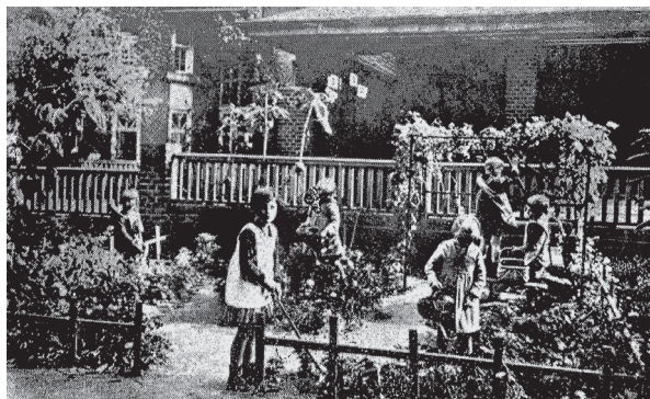
Figura 1: Banho de sol na Escola Uruguai (Distrito Federal). Fotografia que ilustra a palestra do inspetor médico Nascimento Silva, “Asseio, vestuário e hábitos higiênicos dos escolares” (Silva, 1930)

http://dx.doi.org/10.1590/S0104-59702021000400020