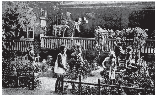
Figura 2: Banho de sol na Escola Uruguai (Distrito Federal). Fotografia que ilustra a palestra do inspetor médico Nascimento Silva, "Asseio, vestuário e hábitos higiênicos dos escolares" (Silva, 1930)