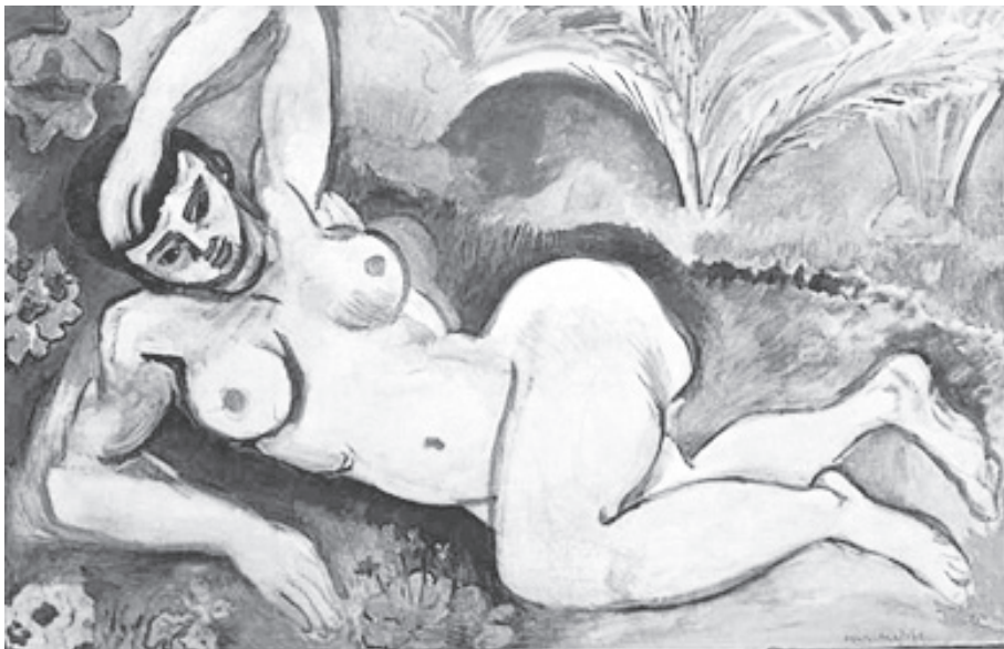
Henri Matisse (French, 1869-1954), Blue Nude, 1907, Oil on canvas, 92.1 x 140.3 cm. The Baltimore Museum of Art: The Cone Collection, formed by Dr. Claribel Cone and Miss Etta Cone of Baltimore, Maryland, BMA 1950.228.

de beleza (Danto, 1997, p. 85) e, em consequência, com os conceitos de gosto e prazer. Duchamp, e seus objetos anestésicos, separa o estético do artístico (Danto, 1997, p. 84). No entanto, os critérios estéticos continuaram a ser utilizados de maneira adaptada. Arthur Danto critica essa situação discutindo longamente com Roger Fry, cuja teoria tem o objetivo, justamente, de alargar o conceito de beleza. Fry e seus contemporâneos atribuem novas características ao conceito de beleza para este se adequar à produção artística moderna. O exemplo dado pelo filósofo é a obra “Blue Nude” de Henri Matisse.