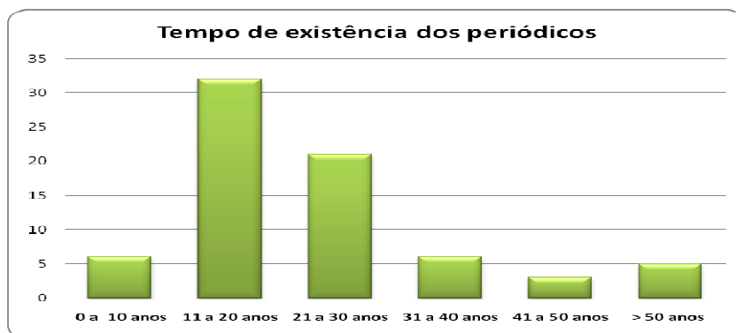
Gráfico 1 – Tempo de existência dos periódicos de Ciências Sociais e de Humanidades indexados na Base SciELO

Esse não parece ser o caso dos periódicos estudados, já que a maior parte deles (72,6%) está concentrada na faixa compreendida entre 11 e 30 anos de existência, além de constarem títulos criados há mais de 50 anos (5 títulos), como exemplo, o periódico Anais da Academia Brasileira de Ciências , criado em 1917. Por outro lado, há uma pequena participação de periódicos mais recentes (6 títulos), sendo de 2004, o mais novo entre os periódicos estudados. Assim sendo, pode-se considerar que a coleção de periódicos de Ciências Sociais e de Humanidades, indexados na SciELO, se constitui basicamente de títulos tradicionais dessas áreas (Gráfico 1).