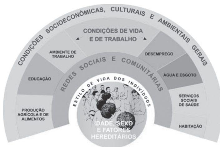
Figura 1 - Determinantes sociais: modelo de Dahlgren e Whitehead

A camada seguinte destaca a influência das redes comunitárias e de apoio, cuja maior ou menor riqueza expressa o nível de coesão social que, como vimos, é de fundamental importância para a saúde da sociedade como um todo. No próximo nível estão representados os fatores relacionados a condições de vida e de trabalho, disponibilidade de alimentos e acesso a ambientes e serviços essenciais, como saúde e educação, indicando que as pessoas em desvantagem social correm um risco diferenciado, criado por condições habitacionais mais humildes, exposição a condições mais perigosas ou estressantes de trabalho e acesso menor aos serviços. Finalmente, no último nível estão situados os macrodeterminantes relacionados às condições econômicas, culturais e ambientais da sociedade e que possuem grande influência sobre as demais camadas.