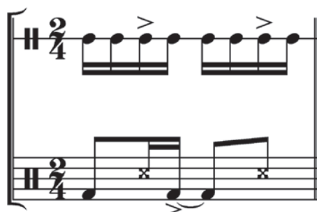
Ex.1 – "Levada" de baião executada por zabumba e triângulo.

A "levada" (condução rítmica) empregada em tais gravações é executada principalmente com zabumba e triângulo. "O ritmo, vindo das danças animadas do sertão, ganhou uma nova configuração com a introdução da zabumba, triângulo e acordeom, que se tornaram o conjunto típico, ao invés do original (viola, tamborim, botijão e rabeça) 11 " (RAMALHO, 1997, p.92). Por vezes, encontramos nas gravações outros instrumentos de percussão como cowbell , agogô, ganzá e pandeiro. No entanto, apesar de tais instrumentos acrescentarem variedade ao aspecto timbrístico, do ponto de vista rítmico eles apenas reforçam os acentos realizados no triângulo e na zabumba. No Ex.1, a pauta superior corresponde ao triângulo e a pauta inferior corresponde à zabumba.