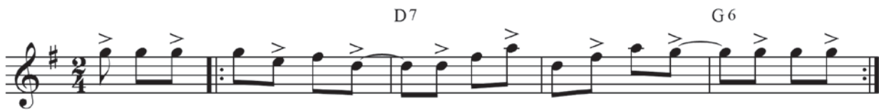
Ex.21 – Trecho final da gravação de 1950 de Dezessete légua e meia de Humberto Teixeira/Carlos Barroso.

que há uma leve acentuação nos contratempos. No final da música Dezessete légua e meia de Humberto Teixeira/Carlos Barroso, Gonzaga fica repetindo o trecho transcrito no Ex.21.