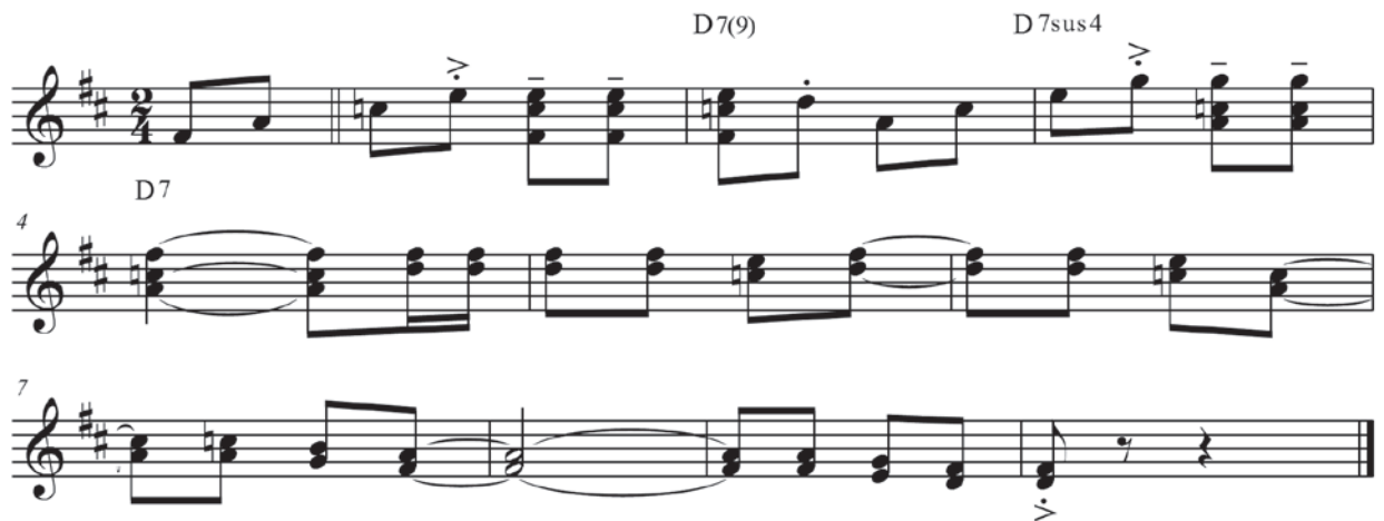
Ex.16 – Introdução presente na gravação de 1950 de No Ceará não tem disso não de Guio de Moraes.

um misto da linha melódica cantada por Luiz Gonzaga (Ex.8) e a parte instrumental executada pelo próprio à sanfona. Dessa forma, temos aproximadamente a "versão instrumental" mostrada no Ex. 13.