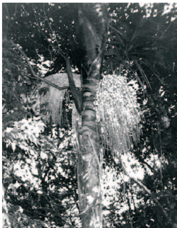
Figura 1 – Oenocarpus bacaba Mart. em fenofase de frutificação. Figure 1 – Oenocarpus bacaba Mart. in fruiting stage.

As observações foram diariamente até a emissão do botão germinativo e, posteriormente, a cada sete dias, verificando-se cada estrutura emitida até o estabelecimento das plântulas. Para esses acompanhamentos foram retirados 10 indivíduos, semanalmente, até que se completasse o estágio de