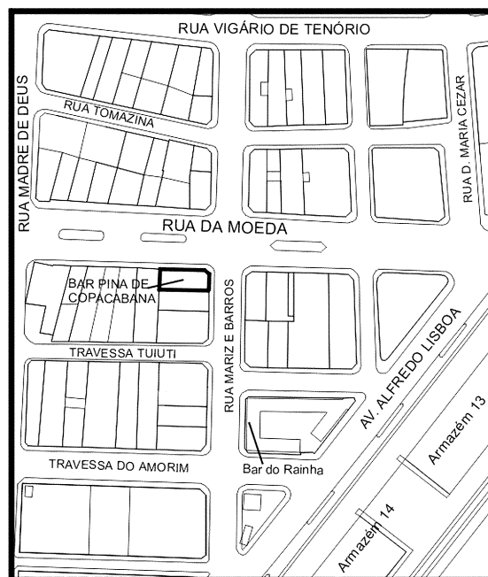
MAPA BAIRRO DO RECIFE DETALHE DO PÓLO MOEDA REFERÊNCIA CARTOGRÁFICA: MAPA-BASE BAIRRO DO RECIFE/ URB

tidos atribuídos – um espaço urbano, como uma public property (Gulick, 1998). O bar Pina de Copacabana, fechado nas primeiras horas do dia, era também uma edificação simbólica, mas, sem os usos, perdia parte da sua eficácia. À noite, quando outras sociabilidades se desenvolviam na rua, esses espaços se emprenhavam de significados: deixavam de ser meros logradouros públicos para se transformarem em lugares .