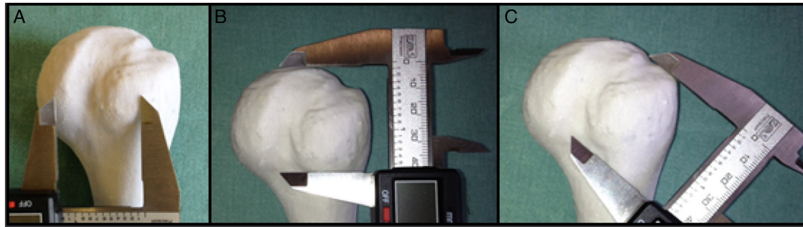
Figura 3 – A, mensuração da distância médio-lateral com paquímetro; B, mensuração craniocaudal com paquímetro; C, mensuração diagonal com paquímetro.