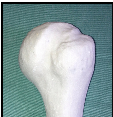
Figura 2 – Protótipo tridimensional em gesso.

Os modelos tridimensionais foram criados a partir das imagens tomográficas da extremidade proximal do úmero pelo software InVesalius 3.0 ® . Com o uso de impressora tridimensional Printer-ZP 310, foram confeccionados os protótipos em gesso, com precisão entre 0,1 mm e 0,2 mm (fig. 2). Com a peça tridimensional confeccionada, usou-se paquímetro digital universal calibrado, com limite de precisão de 0,05 mm, para fazer as mensurações da lesão de HS, em obediência à padronização determinada para medida no software (fig. 3). A mensuração, tanto no modelo real quanto no software, foi feita