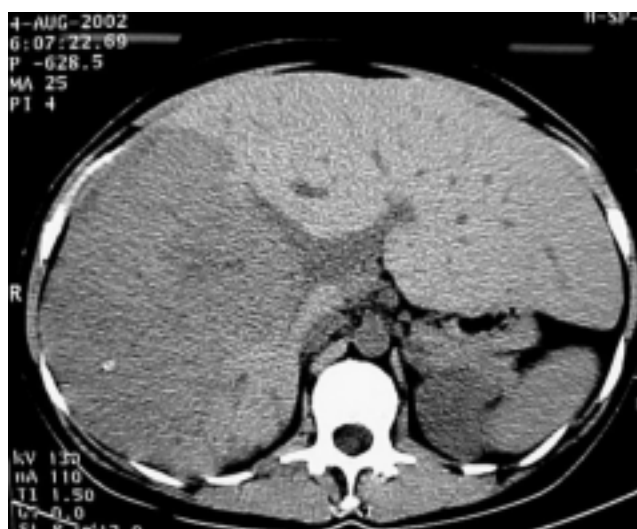
Figura 1 - TC: volumoso tumor ocupando o fígado direito.

vascular hepática. A ressecção hepática foi realizada com auxílio de bisturi ultra-sônico, com perda sanguínea mínima, sem necessidade de reposição. No pós-operatório a paciente foi mantida por três dias em UTI com alta hospitalar no 5º dia após procedimento. A histologia mostrou tecido hepático tumoral compatível com HF (Figura 2). Em seguimento ambulatorial a paciente encontra-se em quimioterapia