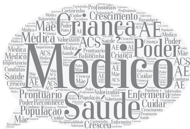
Figura 3 – Nuvem de palavras da categoria ‘Manutenção do modelo médico hegemônico’

A técnica nuvem de palavras ratificou a análise dessa categoria, evidenciando as palavras ‘Médico’, ‘Saúde’, ‘Criança’, ‘Poder’, conforme apresenta a Figura 3.