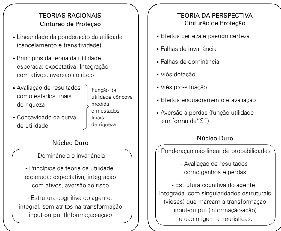
Figura 2: Esquema comparativo

A Figura 2 ilustra a comparação entre as teorias racionais de decisão sob risco e a teoria da perspectiva nos termos lakatoseanos a que recorremos. (Ver esquema abaixo).