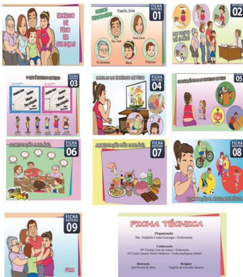
Figura 1 – Capa, figuras y ficha técnica de la primera versión del álbum seriado, titulado “Exceso de peso en niños”. Fortaleza, CE, Brasil, 2014