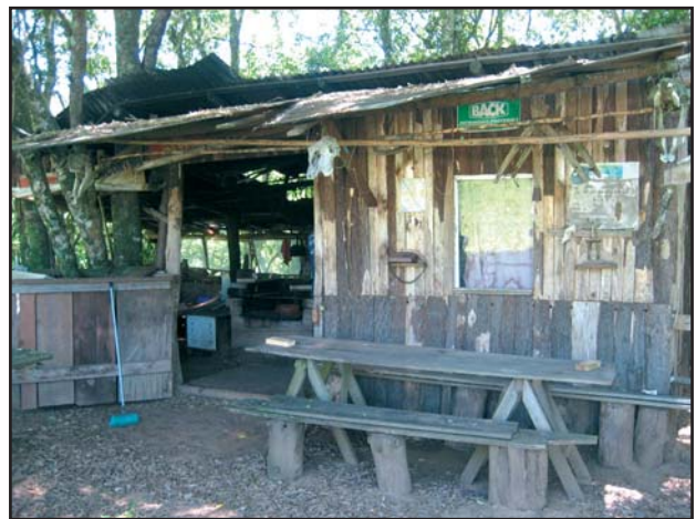
Figura 3 - Cabana de pesca as margens do Rio Caveiras, na qual foram encontrados os exemplares de Panstrongylus megistus .

cabana. Observou-se que a cabana de pesca (Figura 3), apresentava características típicas da zona rural, com estrutura de madeira de Pinus rústicos, sem reboco externo e parte anexa, também de madeira recobertas por costaneira. O peridomicílio encontrava-se desorganizado, mas pouco denso, com acúmulo de materiais diversos (madeira, ferragens, etc). Ainda no peridomicílio, foram observadas várias palmeiras, locais considerados como possíveis habitats dessa espécie de triatomíneo 2 . No intradomicílio, foram encontradas ninfas no armário embutido da cozinha, cuja parede do fundo era a mesma da cabana, que foi colonizado por roedores (não encontrados). Neste mesmo mês, foram coletados 15 triatomíneos da residência, consistindo de 15 ninfas de 1° a 5° estádios, identificadas como Panstrongylus megistus pelo Laboratório de Entomologia da 27ª GERSA e também pelo Laboratório de Transmissores de Hematozoários do Departamento