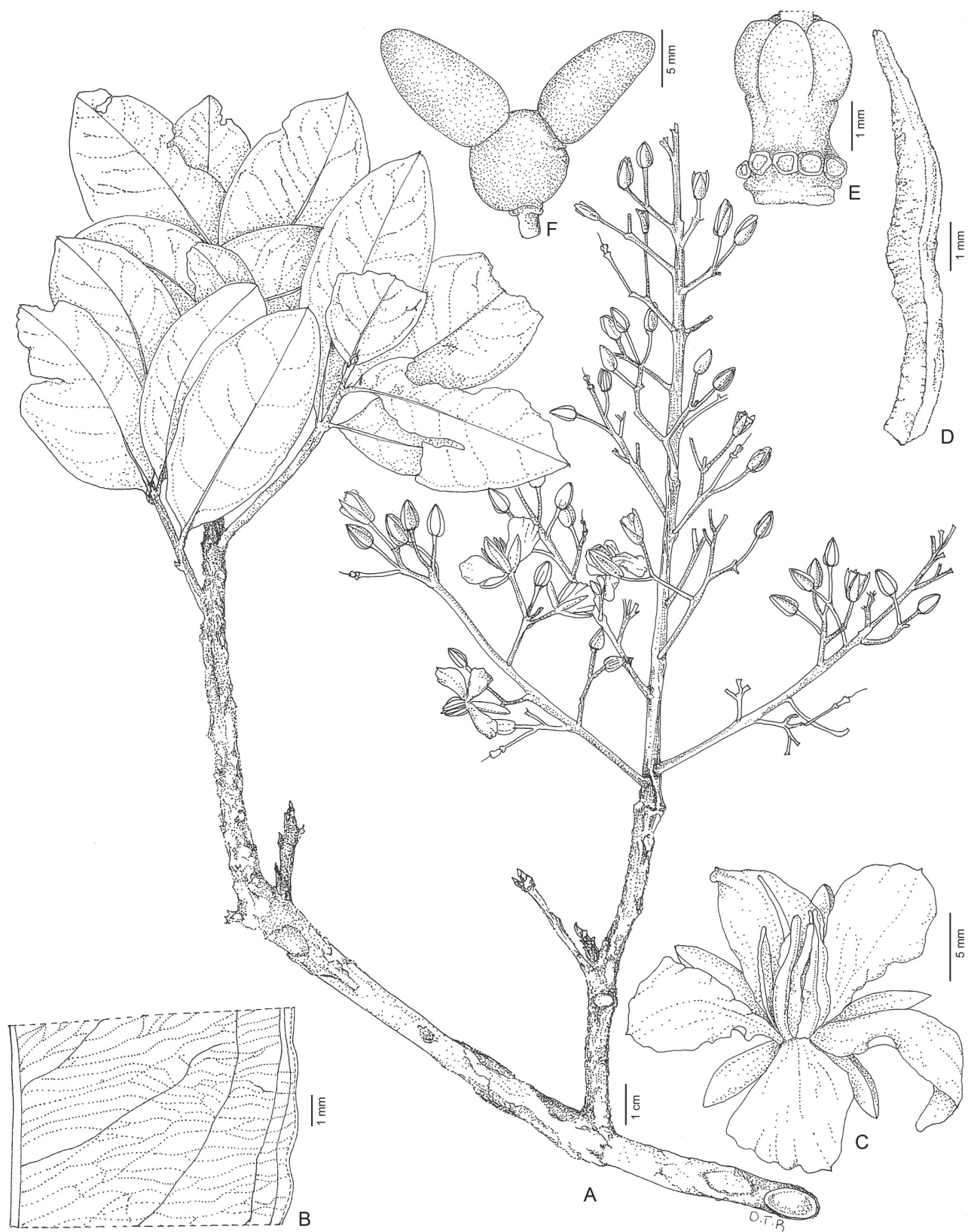
Figura 2. Ouratea spectabilis Engl. A, ramo fértil. B, folha detalhe das nervuras e margem. C, aspecto geral da flor. D, antera. E, ovário, ginóforo e base do estilete. F, fruto. A-E (Salvador 24). F (Gatti & Schutz 10).