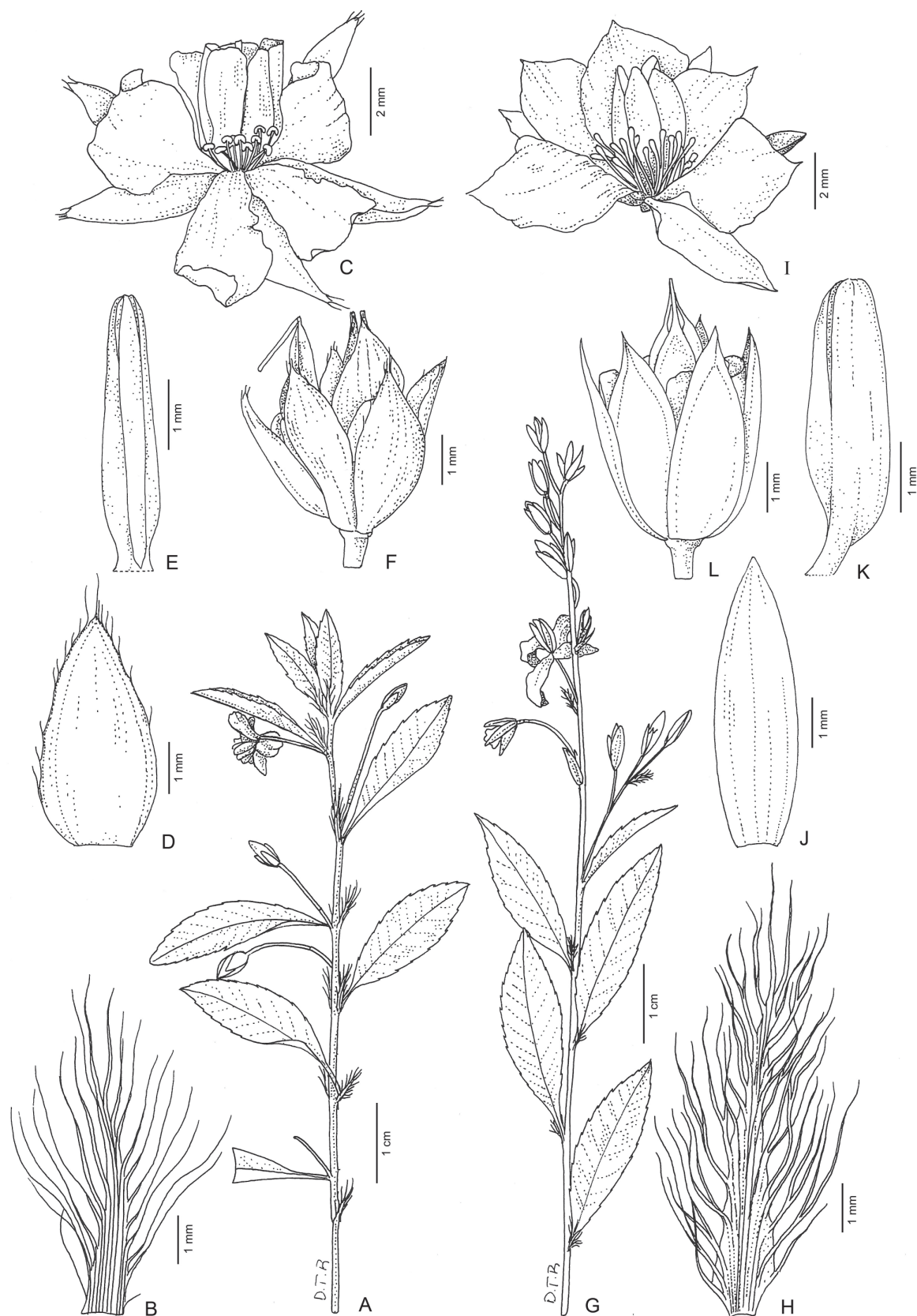
Figura 4. Sauvagesia erecta L. A, ramo fértil, B, estípula. C, aspecto geral da flor. D, sépala. E, estame. F, fruto. A, F (Hatschbach 309). B, D, E (Salvador 16). C (Salvador 31). Sauvagesia racemosa A.St.-Hil. G, ramo fértil. H, estípula. I, aspecto geral da flor. J, sépala. K, estame. L, fruto. G-H, J-L (Cervi et al. 6063). I (Hatschbach 3830).