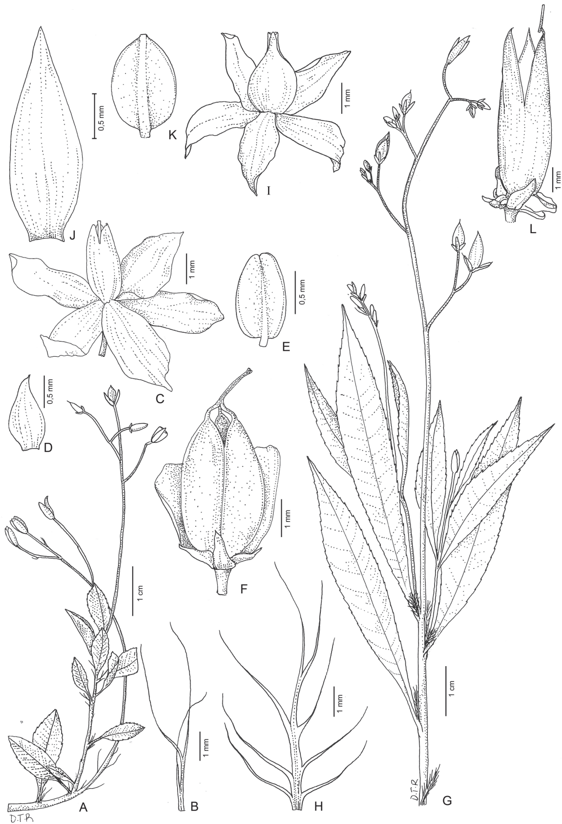
Figura 3. Sauvagesia capillaris (A.St.-Hil.) Sastre. A, ramo fértil. B, estípula. C, aspecto geral da flor. D, sépala. E, estame. F, fruto. A-D (Hatschbach 11953). E (von Linsingen 32). Sauvagesia vellozii (A.St.-Hil.) Sastre. G, ramo fértil. H, estípula. I, aspecto geral da flor. J, sépala. K, estame. L, fruto. G, J-K (Hatschbach 22448). H-I, L (Frenzel s. n., MBM 6345)