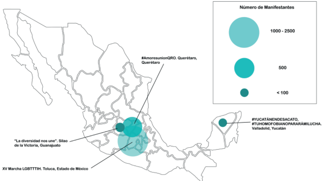
Mapa 1. Número de manifestantes en cuatro marchas LGBTQ+ de México