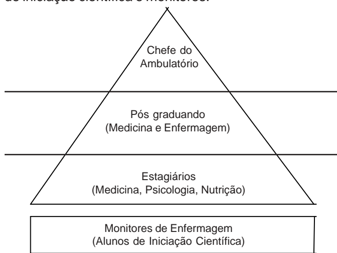
Figura 1 – Níveis hierárquicos do ambulatório de esquistossomose

Organizar significa agrupar, estruturar e integrar os recursos organizacionais. Nesse âmbito, o enfermeiro tem papel fundamental na estrutura organizacional, pois, além de administrar, estabelece a divisão do trabalho da equipe, define os níveis de autoridade e de responsabilidade (2) . A Figura 1 ilustra o nível hierárquico do Setor, constituído por um chefe, médico e Professor adjunto, para a orientação dos demais profissionais de saúde (médicos, enfermeiros e psicóloga) no atendimento ao portador de esquistossomose. A seguir, encontramos os pós-graduandos de Medicina e de Enfermagem, responsáveis pela administração e organização do ambulatório, onde atuam residentes, estagiários, alunos de iniciação científica e monitores.