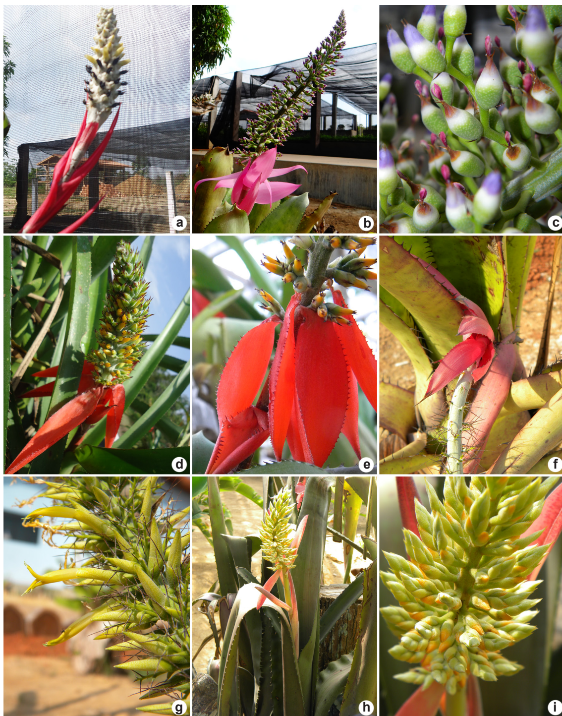
Figura 2 – a. Aechmea bromeliifolia – detalhe da inflorescência; b-c. Aechmea castelnavii – b. detalhe da inflorescência; c. flores e frutos imaturos; d-e. Aechmea mertensii – d. detalhe da inflorescência; e. detalhe das brácteas; f-g. Aechmea setigera – f. detalhe das brácteas da base do pedúnculo; g. detalhe da inflorescência; h-i. Aechmea tocatina – h. hábito fértil; i. detalhe da inflorescência.

Figure 2 – a. Aechmea bromeliifolia – detail of inflorescence; b-c. Aechmea castelnavii – b. detail of inflorescence; c. flowers and immature fruits; d-e. Aechmea mertensii – d. detail of inflorescence; e. detail of bracts; f-g. Aechmea setigera – f. detail of bracts at peduncle base; g. detail of inflorescence; h-i. Aechmea tocatina – fertile habit; i. detail of inflorescence.