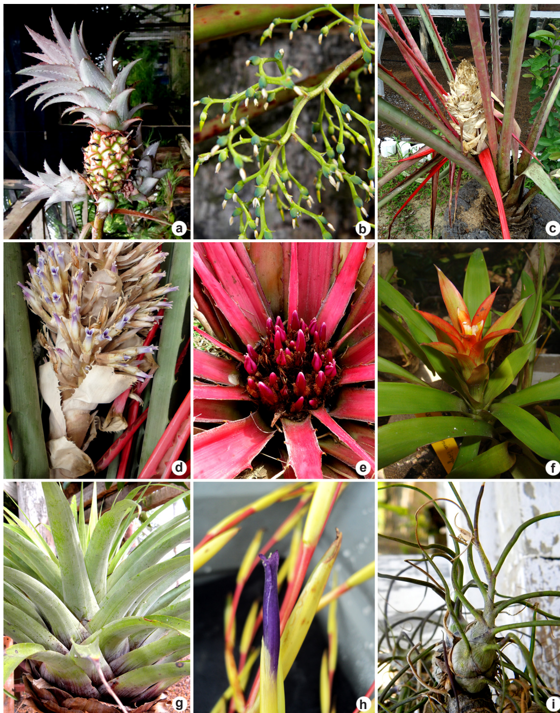
Figura 3 – a. Ananas ananassoides – detalhe da infrutescência; b. Araeococcus micranthus – detalhe da inflorescência; c-d. Bromelia goeldiana – c. hábito fértil; d. detalhe da inflorescência e flores; e. Bromelia grandiflora – detalhe da inflorescência; f. Guzmania lingulata – hábito fértil; g-h. Tillandsia adpressiflora – g. hábito vegetativo; h. detalhe da flor; i. Tillandsia bulbosa – hábito vegetativo.

Figure 3 – a. Ananas ananassoides – detail of infrutescence; b. Araeococcus micranthus – detail of inflorescence; c-d. Bromelia goeldiana – c. fertile habit; d. detail of inflorescence and flowers; e. Bromelia grandiflora – detail of inflorescence; f. Guzmania lingulata – fertile habit; g-h. Tillandsia adpressiflora – g. vegetative habit; h. detail of flower; i. Tillandsia bulbosa – vegetative habit.