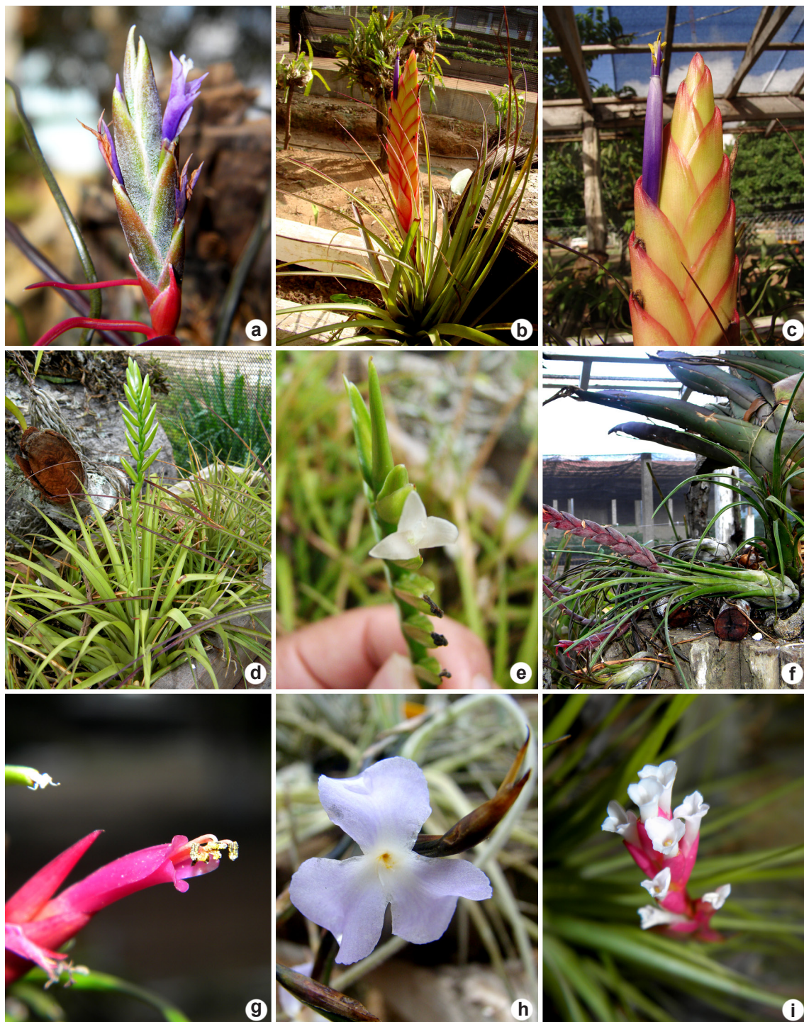
Figura 4 – a. Tillandsia bulbosa – detalhe da inflorescência; b-c. Tillandsia fasciculata – b. hábito fértil; c. flor; d-e. Tillandsia monadelpha – d. hábito fértil; e. detalhe da flor; f-g. Tillandsia paraensis – f. hábito fértil; g. detalhe da flor; h. Tillandsia tenuifolia – detalhe da inflorescência; i. Tillandsia streptocarpa – detalhe da flor.

Figure 4 – a. Tillandsia bulbosa – detail of inflorescence; b-c. Tillandsia fasciculata – b. fertile habit; c. flower; d-e. Tillandsia monadelpha – d. fertile habit; e. detail of flower; f-g. Tillandsia paraensis – f. fertile habit; g. detail of flower; h. Tillandsia tenuifolia – detail of inflorescence; i. Tillandsia streptocarpa – detail of flower.