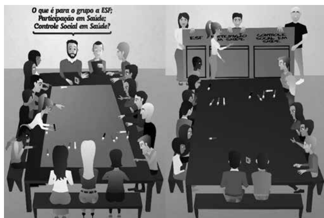
Figura 4 - Primeiro e segundo momentos da etapa Discussão da oficina