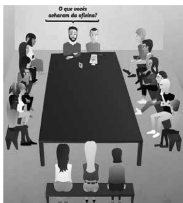
Figura 5 - Etapa Avaliação da oficina

Por fim, a avaliação consistiu no fechamento diário de cada encontro aproximando e distanciando da realidade dos participantes e estava pautada na seguinte pergunta: O que os participantes acharam da oficina? Além de direcionar a oficina para o término e de oportunizar aos participantes fazerem suas considerações sobre o encontro, esta etapa permitiu ainda que pudessem ser reforçados aspectos inconclusos, incompletos e inacabados, que foram abordados na parte intermediária da oficina. Posteriormente, seguiu-se uma confraternização com o grupo, oportunizando uma maior integração e descontração. A Figura 5 ilustra e finaliza as etapas da oficina: