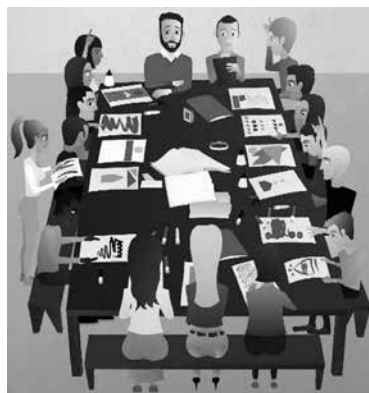
Figura 3 - Etapa Apresentação da oficina

A apresentação consistiu na socialização entre os integrantes de suas percepções sobre as produções. As produções foram sendo coletivizadas de maneira espontânea no grupo, de acordo com a temática discutida no encontro (Figura 3).