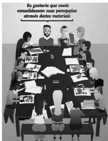
Figura 2 - Segunda etapa Produção da oficina.

Na sequência, procedeu-se ao segundo momento da oficina chamado etapa produção. Este consistiu na explicação e realização de uma das Dinâmicas de Sensibilidade e de Criatividade do MCS (o método tem várias dinâmicas) intitulada Livre para Criar (10) . Para este encontro grupal, foram disponibilizados cartolinas, canetas hidrocor, pincel atômico, giz de cera, tinta, cola, revistas, jornais, fita adesiva e tesouras. A Figura 2 ilustra esta segunda etapa da oficina: