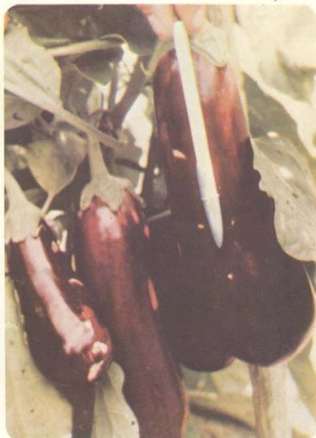
Fig. 3 — Híbrido de beringela ( Solanum melongena L.) produzido pela Divisão de Genética e Melhoramento.

A Divisão de Fruticultura está concentrando seus esforços em algumas poucas espécies, dado a impossibilidade trabalhar produtivamente com a infinidade de frutíferas da Amazônia. As espécies que recebem a atenção dos pesquisadores são fruteiras com pouca expressão econômica mas que, por diversas razões, possuem uma alta potencialidade para se tornarem culturas promissoras. As fruteiras com expressão atualmente são amplamente estudadas pela EMBRAPA e o pequeno grupo da Divisão de Fruticultura do INPA não pre-