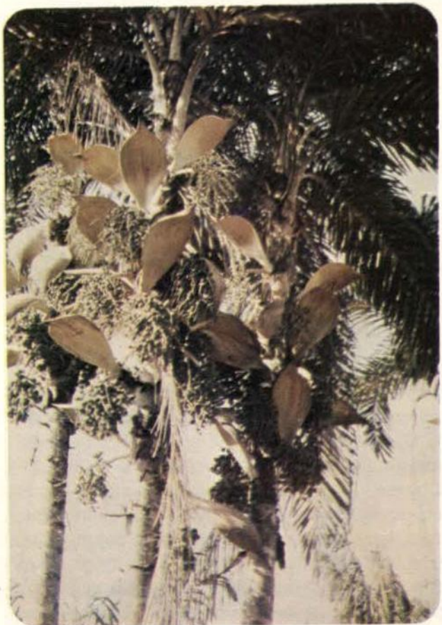
Fig. 5 — Seleção para produtividade em árvores de pupunha ( Bactris gasipaes H.B.K.) com 42 cachos por planta.