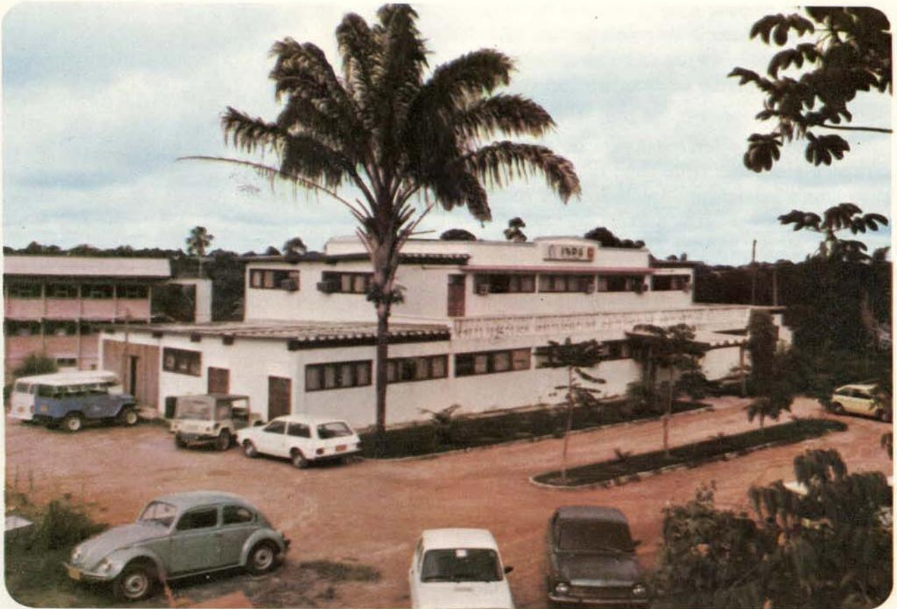
Fig. 2 — Prédio atual de funcionamento do Departamento de Ciências Agrônomicas.

modificando setores e pessoal mas sempre com os mesmos objetivos, visando oferecer aos produtores maiores facilidades para produção e aos consumidores alimento de boa qualidade e a preços acessíveis. As sementes disponíveis no mercado atualmente são de cultivares melhoradas para regiões com condições edafoclimatológicas diferentes da Amazônia e portanto torna-se difícil uma adaptação, necessitando então a produção "in loco" de semente básica melhorada (Pahlen et al. 1978),