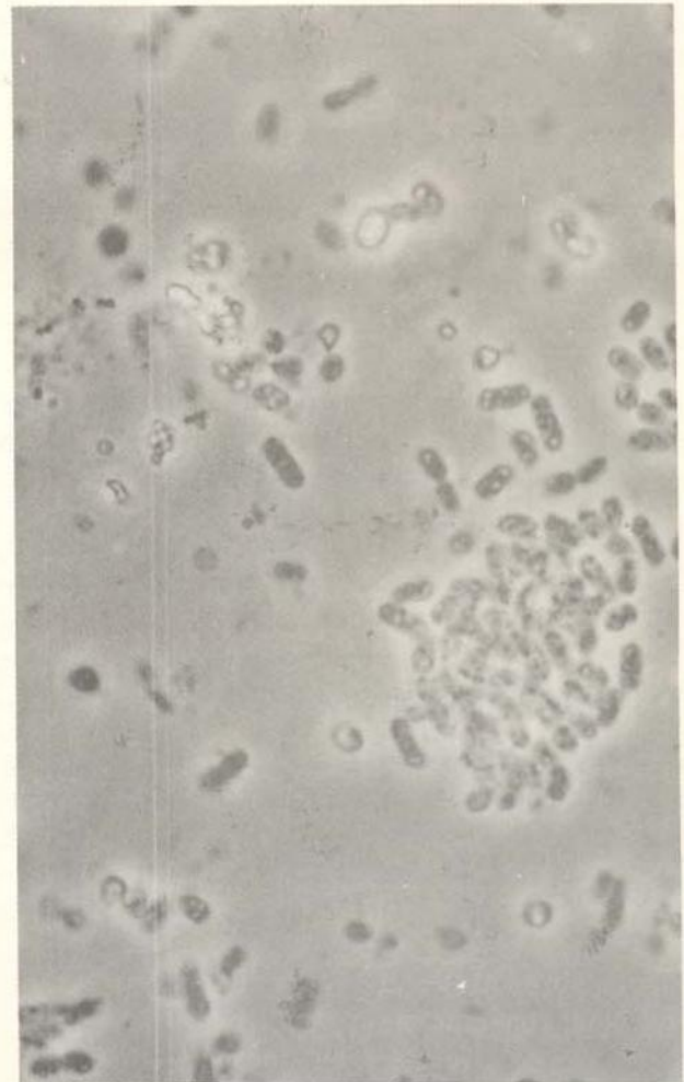
Fig. 7 — Bactéria fixadora de nitrogênio isolada de Paspalum plicatum , não enquadrada na descrição dos gêneros existentes.