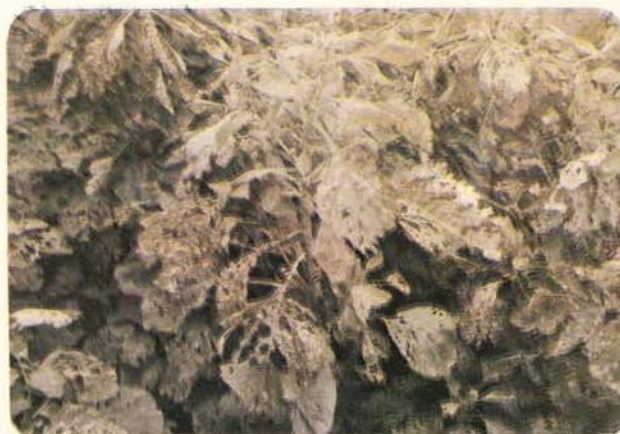
Fig. 6 — Cultura de Amaranthus gangeticus fortemente atacada por doença fúngica e pragas.

Estudos fenológicos indentificaram 3 espécies de bom crescimento na região: a pupunha ( Bactris gasipaes ), a fruta-pão ( Artocarpus atilis ) e a jaca ( Artocarpus integrifolia ). Todas constituem-se em alimentos básicos em uma ou outra parte do mundo e tem grandes produções.