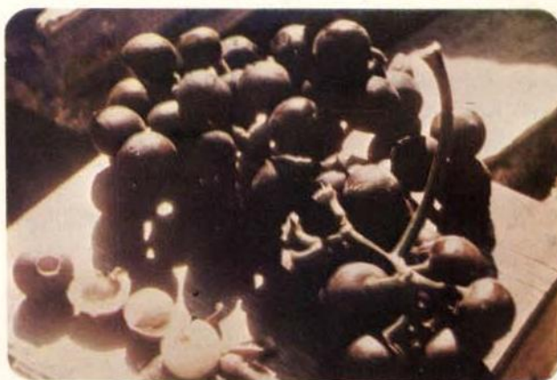
Fig. 4 — Mapati ( Pourouma cecropiaefolia Mart.) fruteira amazônica de alta produção, rápido crescimento e sabor semelhante à uva, podendo substituí-la nas regiões tropicais.

No início do ano de 1980 foi plantado o germoplasma colhido no ano anterior acrescentando 10 espécies novas com 12 introduções e aumentando o número de introduções sobre as espécies prioritárias com material genético