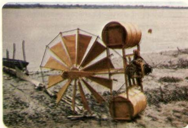
Fig. 9 — O "Cata-águas" que produziu a primeira hidreletricidade do rio Solimões.

A geração de eletricidade foi feita usando uma turbina de fluxo axial ligado a um alternador de carro. A forma do rotor era de um catavento cretense de 2 m de diâmetro com 12 pás. Totalmente submerso em uma correnteza de 2,2 km/h do rio Solimões o rotor manteve acesa uma lâmpada de 40 W — a primeira hidreletricidade a sair do maior rio do mundo em volume d'água. As experiências atuais visam aperfeiçoar o aparelho e aumentar sua potência.