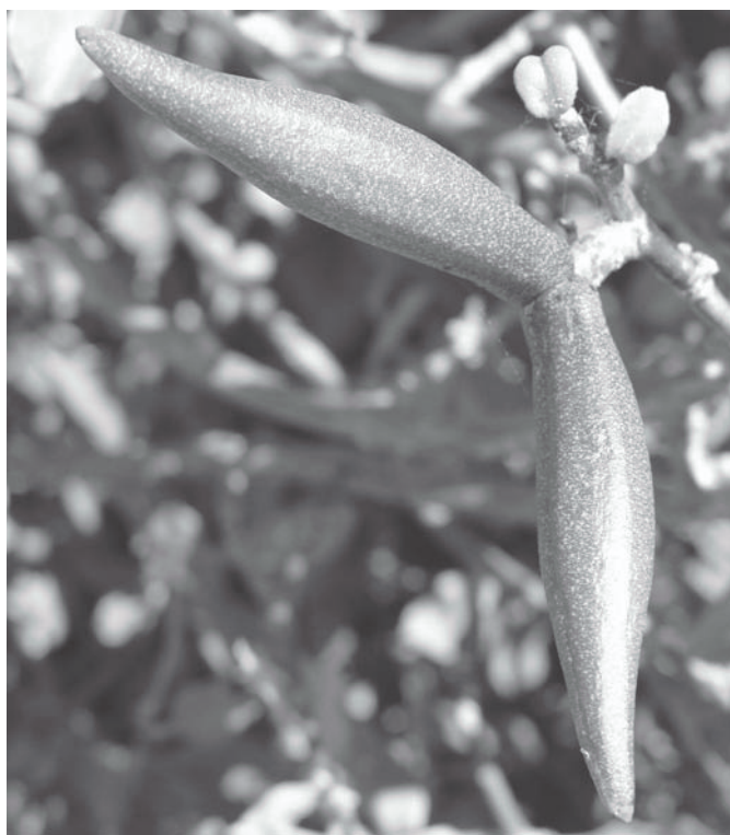
Fig.4. Cápsula de Marsdenia sp. Município de Caicó, Rio Grande do Norte.