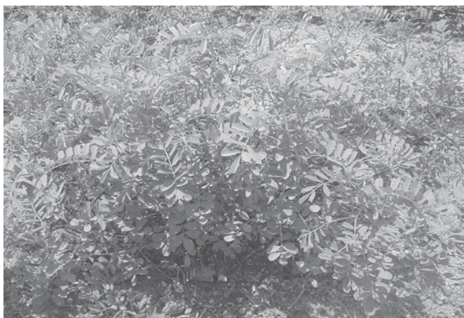
Fig.5. Tephrosia cinerea . Município de São José do Seridó, Rio Grande do Norte.

Tephrosia cinerea (anil-falso). Doze entrevistados observaram surtos de intoxicação por Tephrosia cinerea (Fig.5 e 6). Um relatou que em 2000, no final do período de estiagem, num rebanho de 60 ovinos, 6 animais adoeceram (marrãs e ovelhas) e 3 marrãs morreram. Na área a planta representava aproximada-