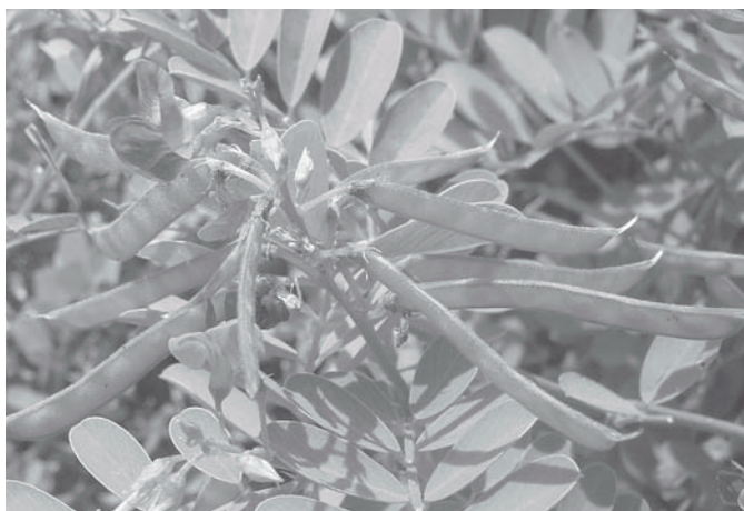
Fig.6. Inflorescência e vagens de Tephrosia cinerea . Município de São José do Seridó, Rio Grande do Norte.