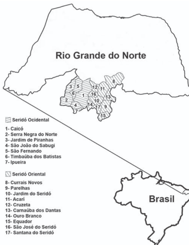
Fig.1. Mapa do Rio Grande do Norte mostrando as regiões do Seridó Oriental e Ocidental, onde foi realizado o levantamento sobre plantas tóxicas para ruminantes.

Considerando-se que não há informações sobre as plantas tóxicas do Rio Grande do Norte e sua importância econômica, este trabalho teve como objetivo determinar as plantas tóxicas das microrregiões do Seridó Oriental e Ocidental desse Estado (Fig.1), assim como a sua distribuição geográfica na região. Para