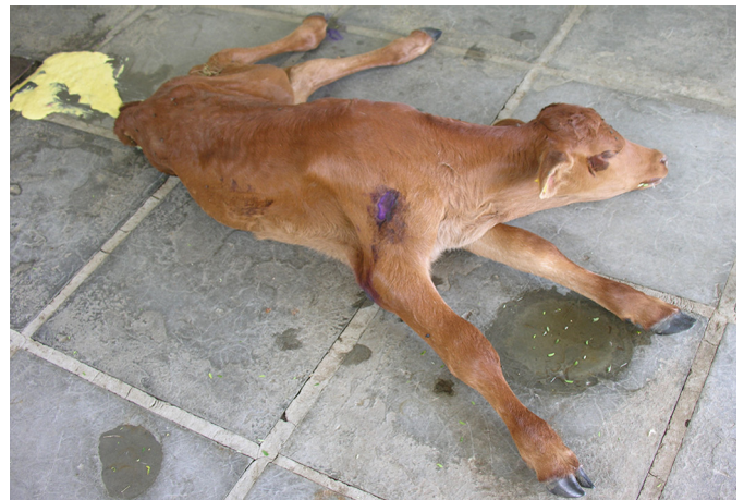
Fig.1. Bezerro com criptosporidiose apresentando fraqueza e diarreia amarela.

Na necropsia do bezerro encaminhado ao LRD/UFPel, macroscopicamente havia congestão dos vasos sanguíneos intestinais e mesentéricos. O intestino delgado apresentava distensão, com presença de gás e com conteúdo esverdeado. O intestino grosso estava, também, distendido, os linfonodos mesentéricos estavam aumentados de tamanho e os vasos linfáticos dilatados (Fig.2).