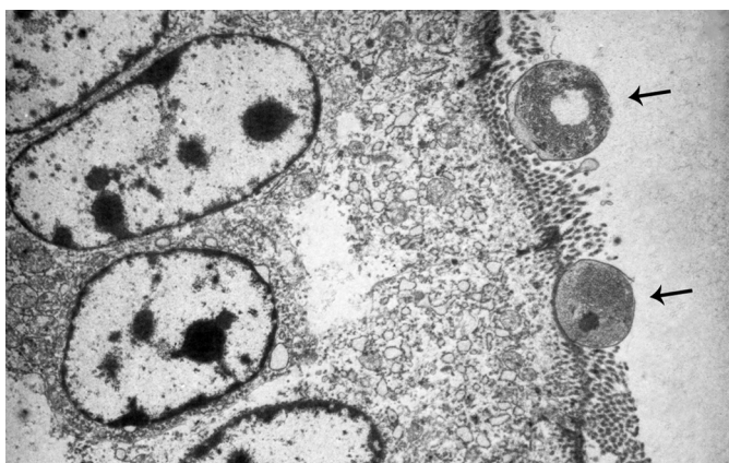
Fig.4. Estruturas arredondadas medindo 1,5-1,75µm de diâmetro que correspondem a trofozoítos de Cryptosporidium spp. aderidos às microvilosidades de enterócitos (setas).