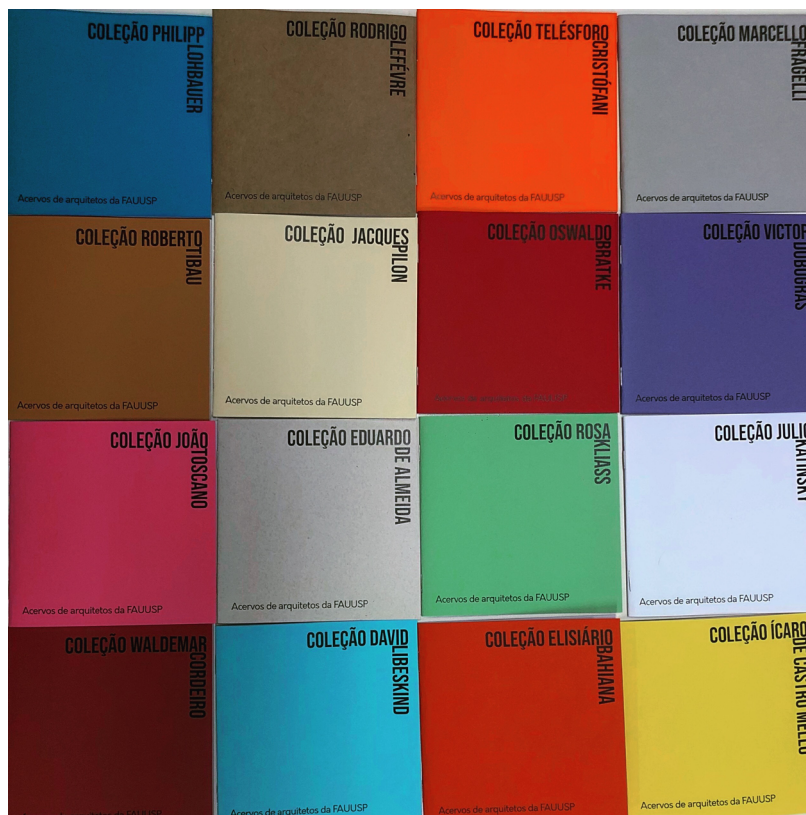
Figura 2 – Guias de coleções de arquitetos sob guarda da Biblioteca desenvolvidas pelos alunos da disciplina AUH 539 e impressos pelo LPG-FAU-USP ao longo de 2019.

Partindo de uma apresentação dos responsáveis pela seção acerca do alcance, heterogeneidade, formas de processamento e cuidados com a preservação do acervo como um todo, nessa última etapa os alunos tiveram a oportunidade de se debruçar sobre o material primário eleito, principalmente por meio de cópias heliográficas e digitais, mas também, excepcionalmente, de desenhos originais, além de toda a documentação relativa à sua doação ou à sua catalogação preliminar. O objetivo foi precisamente produzir descrições panorâmicas das principais características da coleção, compreendendo as diferentes encomendas do arquiteto, programas e tipologias, a distribuição cronológica dos projetos e o estado geral de conservação do conjunto, bem como sistematizar essas informações em tabelas. 20 Em todas as etapas, dos levantamentos e definição de matrizes comuns de conteúdos à redação final, o trabalho foi construído e acompanhado no interior da disciplina. Em face da qualidade dos produtos e do interesse público do acervo, foi também incluída no exercício a disponibilização dos resultados, com vistas à sua difusão em outros centros de pesquisa e documentação, na forma de pequenos guias das coleções trabalhadas, impressos pela Seção Técnica de Produção Editorial da FAU-USP (Figura 2). 21