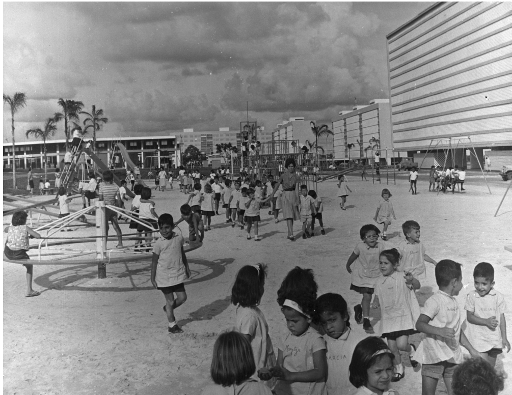
Figura 4 – Atividades escolares no parque recreativo infantil em superquadra de Brasília (sem data).