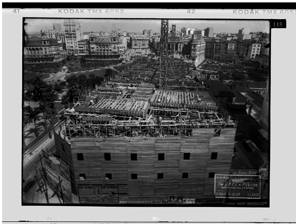
Figura 5 – Imagem do canteiro de obras do edifício Alexandre Mackenzie, atual Shopping Light, São Paulo (1927-1928).