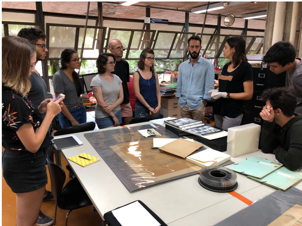
Figura 1 – Apresentação de desenhos e outros materiais profissionais de arquitetos e formas de tratamento e consulta de coleções dessa natureza aos alunos da disciplina AUH 539, na Seção Técnica de Materiais Iconográficos da Biblioteca da FAU-USP, 2019.

O exercício iniciou-se pela eleição, por parte dos alunos, de uma das coleções profissionais disponíveis na Seção Técnica de Materiais Iconográficos da Biblioteca da FAU-USP. A escolha considerou aquelas que, segundo os critérios da seção, estavam em fase preliminar de catalogação ou haviam sido apenas recentemente incorporadas. Em uma primeira etapa, os alunos se detiveram na elaboração de uma sùmula biográfica do arquiteto focalizado, o que lhes permitiu situar melhor o conteúdo do acervo na trajetória profissional, intelectual e acadêmica correspondente. Num segundo momento, contando também com a orientação das bibliotecárias da FAU-USP, o foco se voltou à produção de dossiês bibliográficos, que lhes possibilitaram realizar um levantamento abrangente da bibliografia ativa e passiva disponível dos/sobre os titulares dos acervos, incluindo depoimentos e entrevistas, assim como projetos de sua autoria publicados em periódicos. A terceira etapa do trabalho foi dedicada às próprias coleções em exame (Figura 1).