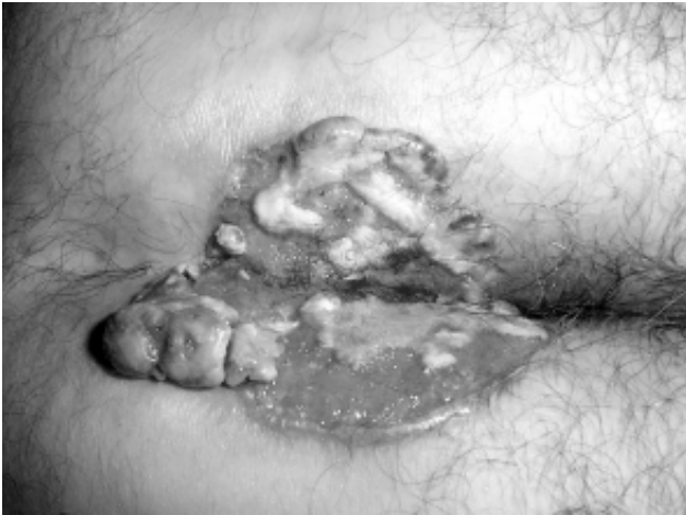
Figura 1 - CBC na margem anal posterior.