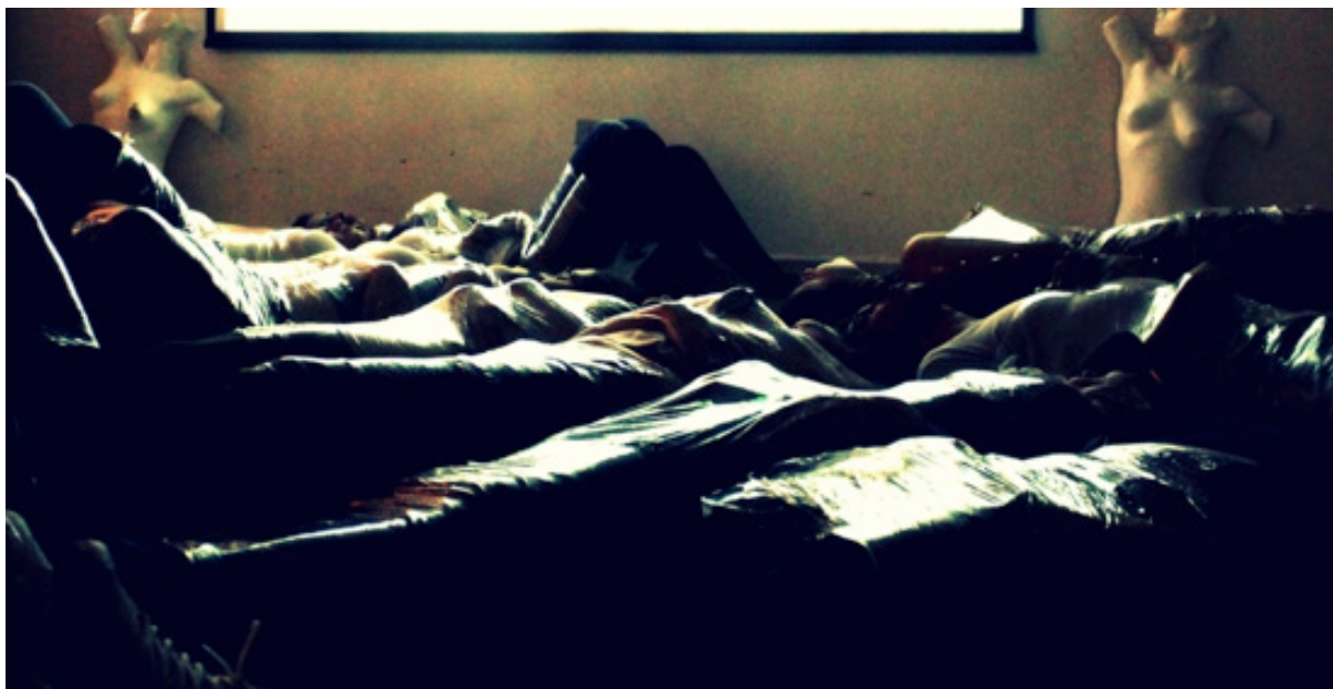
Figura 3: Corpos-casulos, oficina de emplastificação

Porém, já é sabido, as marcas permanecem e geram bifurcações em nossas subjetividades, e ali nasciam linhas que apontavam para uma política de vizinhança entre a carne e o plástico, entre razão e sensação, entre a Psicologia e a Arte. Essa prótese-plástica trabalha para a ativação de nosso corpo vibrátil (Guattari & Rolnik, 1999), ativação que nos abre para exercícios de liberdade conosco, com o outro, com nossos desejos e com a própria prática do pensamento. O que está em tela é a potência dos corpos fazer vibrar a música do mundo, traçando linhas de fuga ao anestesiamiento.