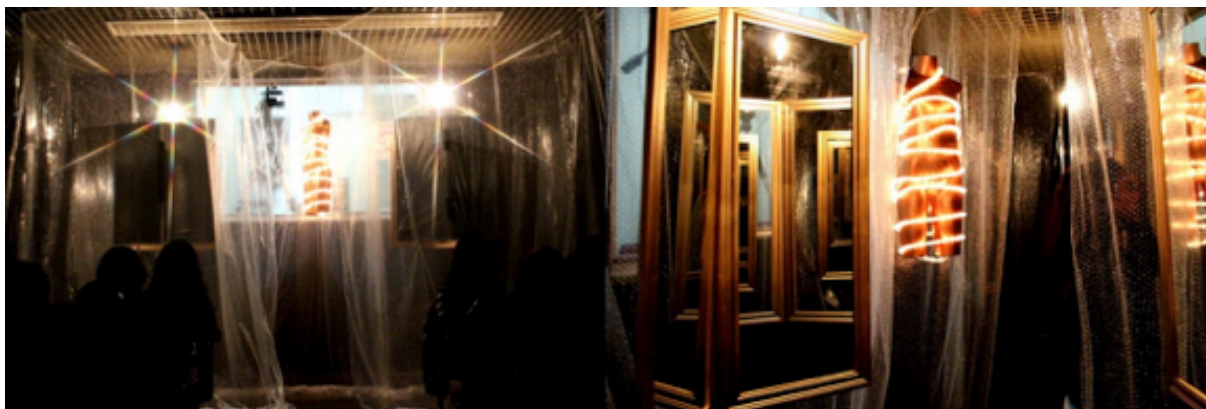
Figura 2: Instalação plástica-orgânica de multiplicação de eu's

No centro da instalação, um corpo plástico de pele dourada todo em luz e neon cintilava e invadia minha retina, dizendo ser possível abrir-se às sensações. Sim, aquela luminosidade ofuscava meus territórios acostumados, amolecia a camada de casca que envolvia minha pele e me abria para algo que ainda desconhecia. Foi aí que percebi que aquela luz apontava para a dimensão maleável do plástico, um estrato de vida no qual não precisávamos ser dóceis, tampouco andar somente em linha reta. Era preciso seguir essa pista de luz, imergir nesse emaranhado de linhas duras e flexíveis, entrar num combate sem fim pelo que flexibiliza e amplia nossos campos existenciais.