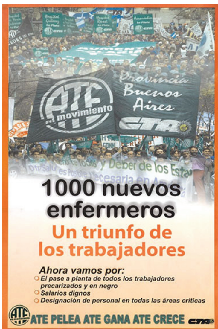
Figura 2: 1.000 nuevos enfermeros. Póster 54x37cm (Central..., s.d.)

Latin America pamphlets (s.d.) digital collection de la Universidad de Harvard pone a disposición de los investigadores cientos de folletos latinoamericanos escasos y únicos, publicados durante los siglos XIX y principios del XX.