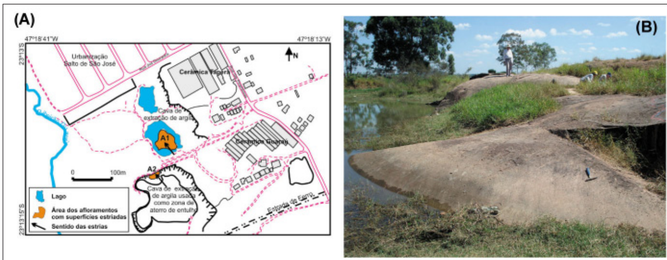
Figura 2 - (A) Contexto local mostrando a localização dos afloramentos onde há superfícies estriadas (A1 e A2). (B) Visão geral do A1.

Sedimentos aquoso-glaciais - ambas as superfícies estriadas estão em contato com um pacote sedimentar superposto composto, principalmente, por lamito siltoso, de cor predominante marrom-claro. No A1, o granito estriado está em contato com um pacote de sedimentos estratificados, cuja espessura varia de dois a três metros, observando-se dobras atectônicas suaves, centimétricas a métricas, formadas por escorregamento e acomodação do material sobre uma superfície originada por erosão glacial. Predominam as camadas formadas por um lamito rico em clastos (10-15% em volume), alguns deles facetados e/ou estriados, e grânulos, distribuídos aleatoriamente. Os clastos são de veio de quartzo (de até 30 cm x 20 cm), de granito e de diversos tipos de rochas sedimentares (de até 30 cm x 20 cm). Os clastos argilo-siltosos, de cor vinho-desbotado, encontram-se bastante intemperizados, enquanto aqueles arenoso-argilosos são esverdeados e os de arenito são marrom-claros. Entre os clastos facetados e