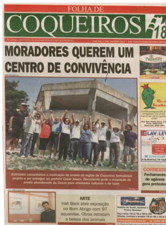
Figura 2 – Jornal comunitário do Bairro de Coqueiros (ano 18, n. 168, de outubro de 2013), em Florianópolis/SC