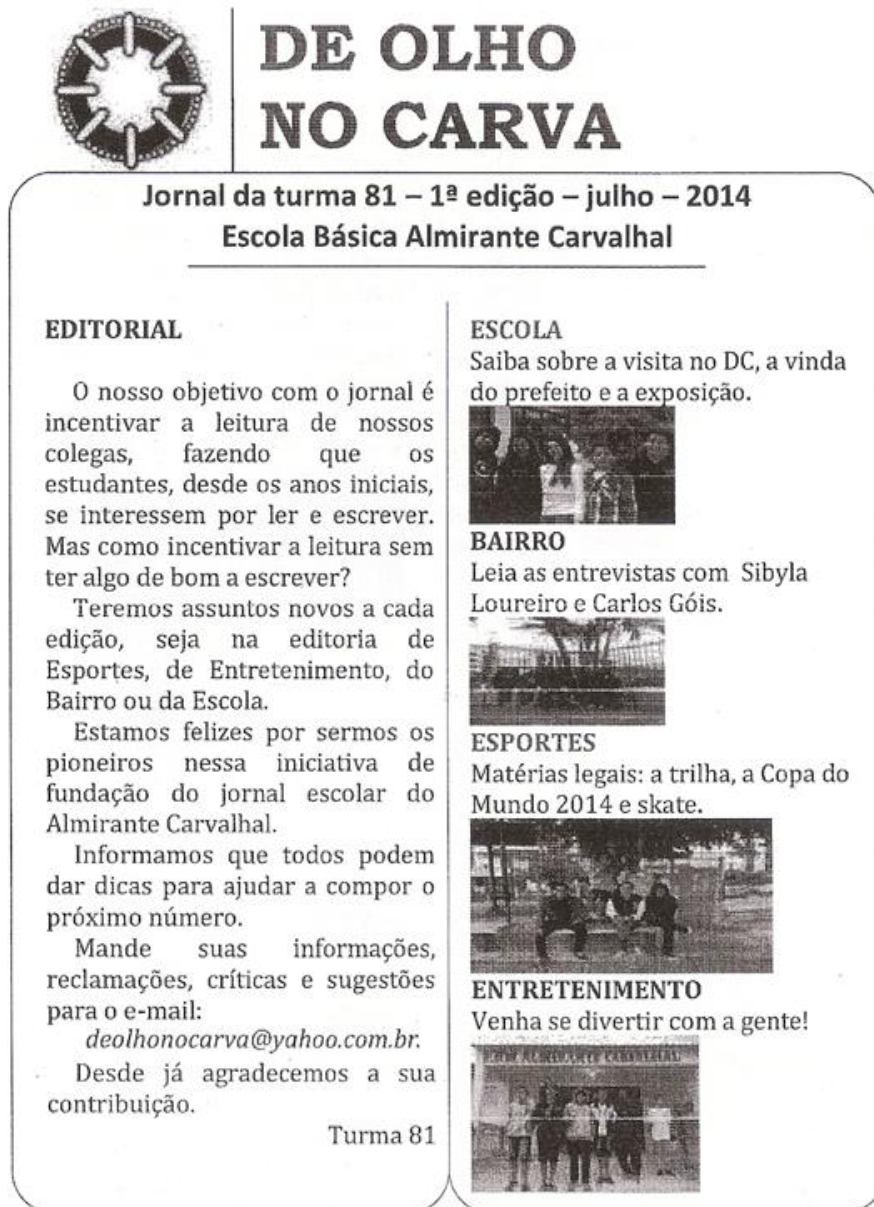
Figura 5 – Capa do jornal produzido