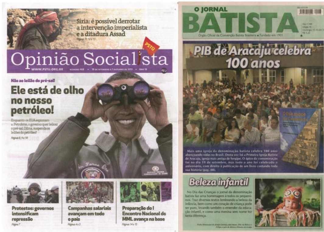
Figura 3 – Jornais contra-hegemônicos em graus distintos (Opinião Socialista, ano 16, n. 468, de 18 de setembro a 1º de outubro de 2013; O Jornal Batista, ano 113, n. 41, de 13 de outubro de 2013)