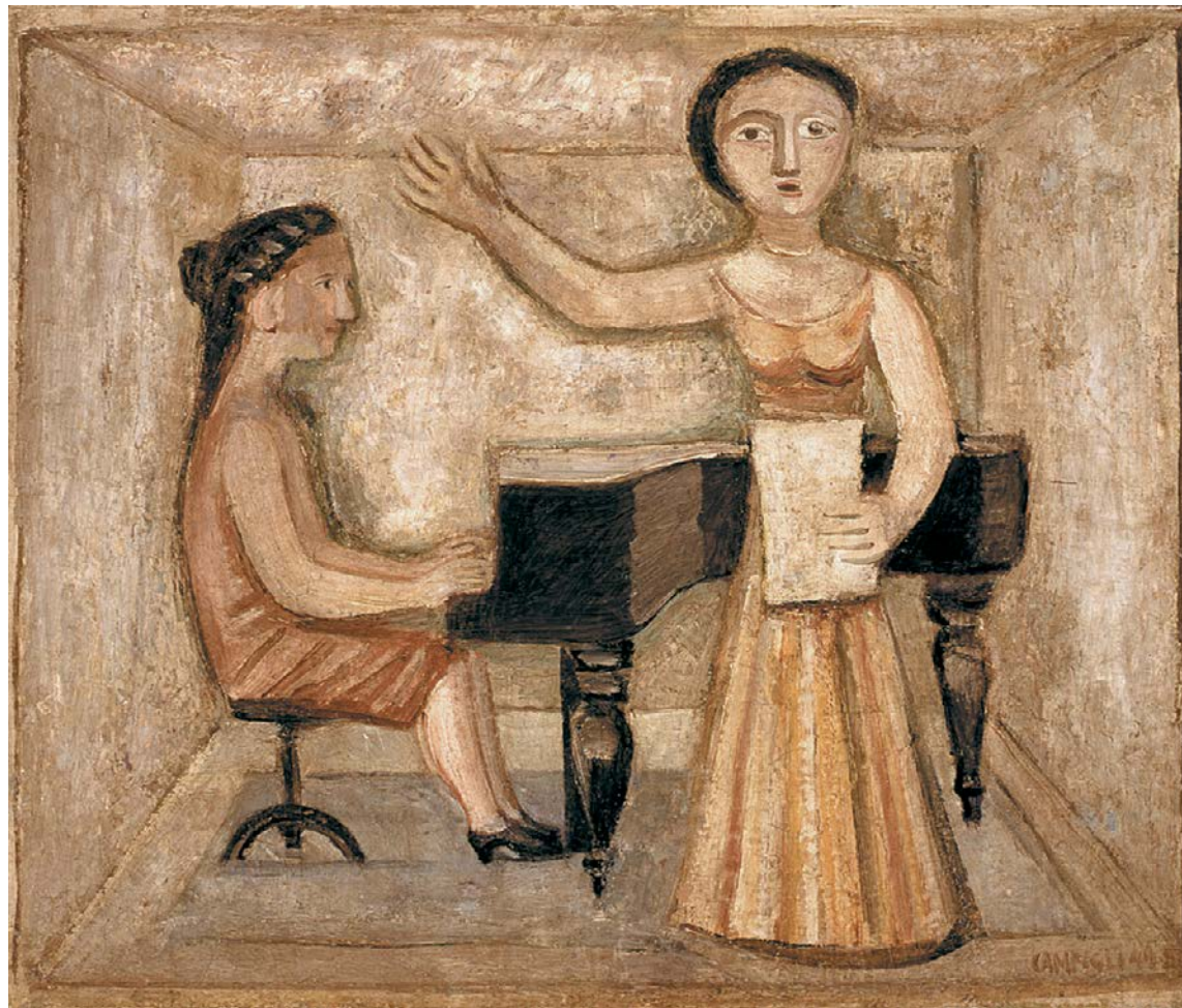
FIGURA 7. Massimo Campigli, A cantora, 1949-1950. Óleo sobre tela, 57,3 x 68,3 cm. Museu de Arte Contemporânea da Universidade de São Paulo, São Paulo.

Como vimos, dentre o conjunto de Campigli no MAC USP, A cantora é a única obra que chega ao antigo MAM SP por intermédio da I Bienal de São Paulo 51 . Com ela é doado o bronze Cardeal , 1948, de Giacomo Manzù. Segundo artigos de jornais e correspondências localizadas no Arquivo da Bienal de São Paulo, o governo italiano