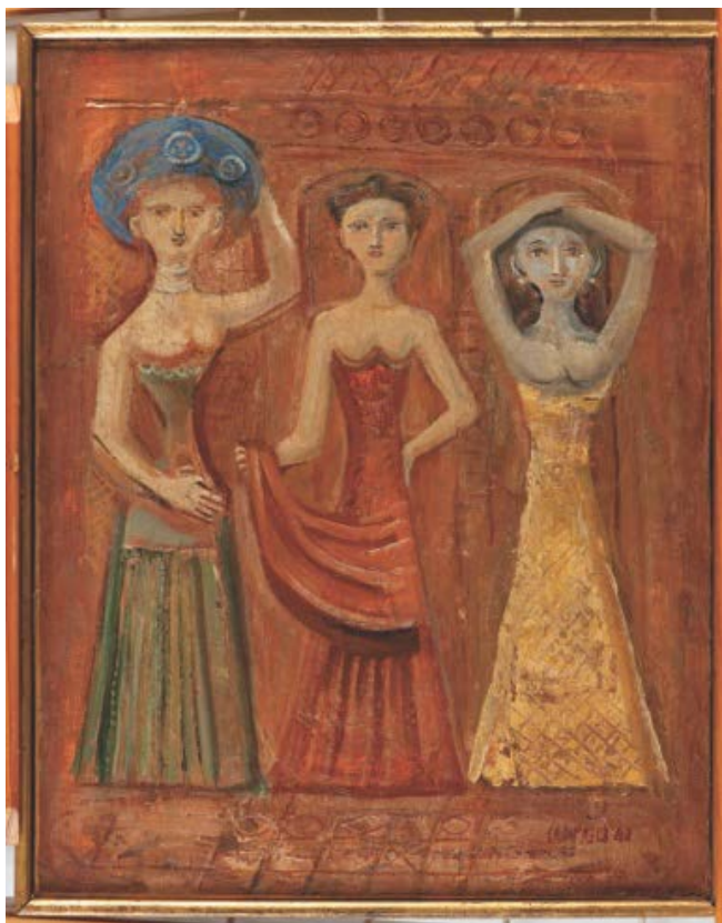
FIGURA 4. Massimo Campigli, Três Mulheres , 1940. Óleo sobre tela, 46,3 x 36,5 cm. Museu de Arte Contemporânea da Universidade de São Paulo, São Paulo. Foto: Romulo Fialdini. © CAMPIGLI, Massimo/ AUTVIS, Brasil, 2020.

Destacamos sua participação junto com outras nove pinturas suas na importante exposição dos Italianos de Paris em Milão em 1930, a “ Prima Mostra di pittori italiani residenti a Parigi ”. Por seu conjunto exposto, Campigli seria definido por Waldemar George como um “pioneiro da arte mental”, que conseguia criar um universo onde os mitos encontravam seus lugares perfeitos ao lado dos postulados da ciência, do espírito crítico e da inquietude moderna (GEORGE apud DELL’ARCO, 1998, p. 61).