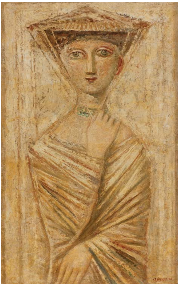
FIGURA 5. Massimo Campigli, Mulher velada , 1946. Óleo sobre tela, 78 x 48,5 cm. Museu de Arte Contemporânea da Universidade de São Paulo, São Paulo. Foto: Romulo Fialdini. © CAMPIGLI, Massimo/ AUTVIS, Brasil, 2020.

remete à escultura em argila ou ao modo de segurar os vestidos, seja o mundo egípcio, na frontalidade e imobilidade das representações ou nos seus vasos canópicos, ou mesmo na alusão a figuras minoico-micênicas.