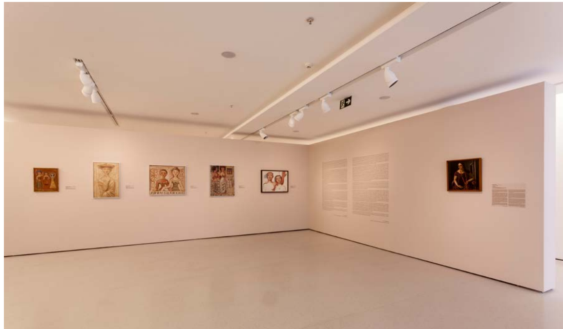
FIGURA 1. Vista com destaque ao conjunto de pinturas de Campigli e de A adivinha , de Achille Funi, no MAC USP 10 .

Logo, analisar a produção de Campigli é iluminar esse artista pela primeira vez em nossa historiografia, ao mesmo tempo que