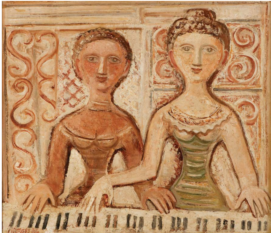
FIGURA 6. Massimo Campigli, Mulheres ao piano , 1946. Óleo sobre tela, 69,5 x 80 cm. Museu de Arte Contemporânea da Universidade de São Paulo, São Paulo. Foto: Romulo Fialdini. © CAMPIGLI, Massimo/ AUTVIS, Brasil, 2020.

de para o teclado, e seus dedos, inclusive, nem parecem tocá-lo. Estão estáticas, esboçando um sorriso, quase como se estivessem posando para uma foto ou simplesmente hipnotizadas. Há algo de artificial em toda cena. Ou talvez isso fosse o que repetiu Campigli: nas suas fantasias, suas mulheres eram “prisioneiras”, a quem ele desejava por detrás de um vidro – etiquetadas e intocadas, como nos museus (CAMPIGLI, 1955, p. 11).