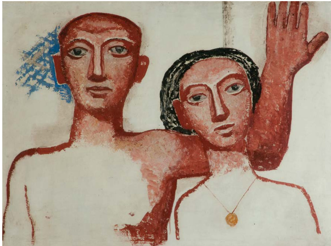
FIGURA 2. Massimo Campigli, Os noivos , 1929 34 . Têmpera sobre tela, 59 x 80 cm. Museu de Arte Contemporânea da Universidade de São Paulo, São Paulo. Foto: Romulo Fialdini. © CAMPIGLI, Massimo/ AUTVIS, Brasil, 2020.