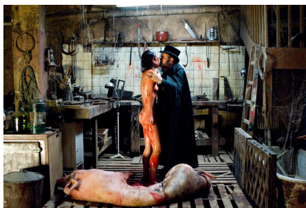
Figs. 1 e 2. Reprodução de fotogramas de Encarnação do Demônio .