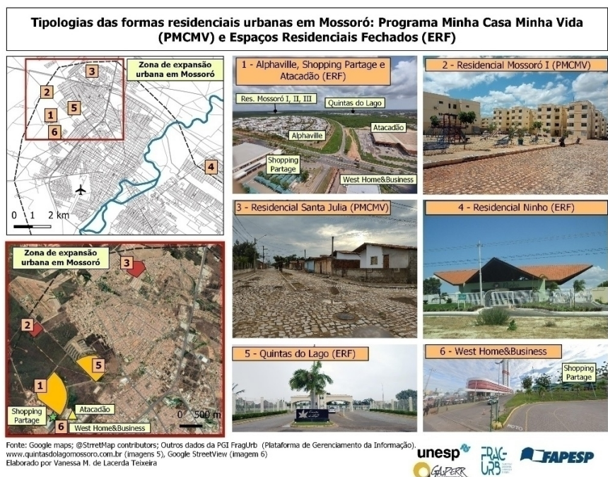
Figura 2 - Mossoró: espaços comerciais, serviços e tipologias habitação.

O shopping-center Partage, situado no bairro Nova Betânia, considerado uma zona de expansão da cidade, vem fomentando um novo modo de consumir na cidade, para além da área central, constituindo um processo em curso de multiplicação de áreas centrais ou de multicentralidade e, assim, estruturando um elemento característico da fragmentação socioespacial, alterando, portanto, o padrão monocêntrico que caracterizava anos anteriores (SPOSITO, 2007; WHITAKER, 2017) ou ainda centralidades tradicionais (SPOSITO; GÓES, 2013).